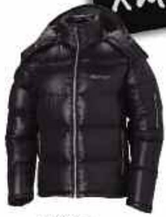
MARMOT Stockholm Jacket