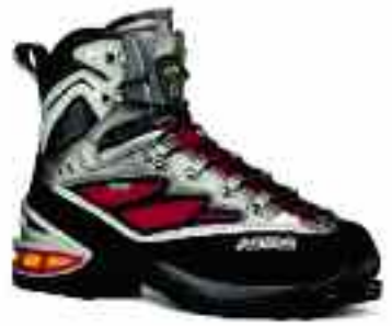
ASOLO Broad Peak GV