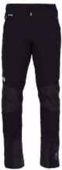
THE NORTH FACE Apex Icefall Pant