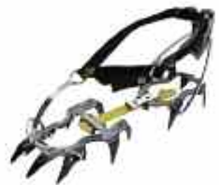
BLACK DIAMOND Serac Pro