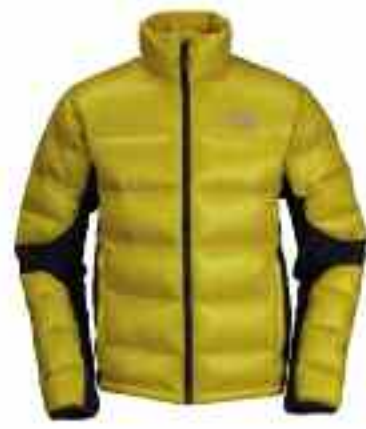
THE NORTH FACE Crimpsatic Hybrid Jacket