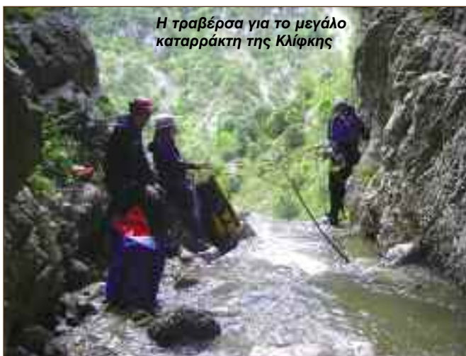
Η τραβέρσα για το μεγάλο καταρράκτη της Κλίφκης

Η περιοχή προσφέρεται ιδιαίτερα για ορειβασία στον ορεινό όγκο των Τζουμέρκων. Οι πλαγιές του Ξηροβουνίου προσφέρονται για αιωροπτερισμό, ενώ ο ποταμός Άραχθος για rafting ή kayak (η γέφυρα της Πλάκας αποτελεί κομβικό σημείο για διαδρομές στο ποτάμι).