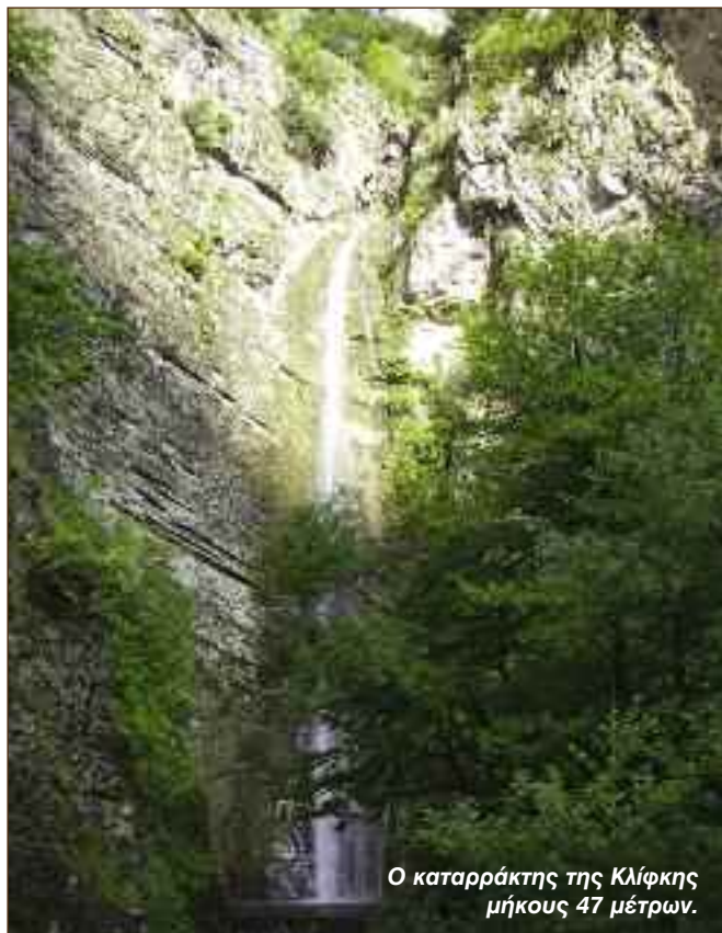
Ο καταρράκτης της Κλίφκης μήκους 47 μέτρων.

3 φορές μέχρι να ενωθεί με το ρέμα του Δελησιά. Το μικρό αυτό φαράγγι είναι πλούσιο σε βλάστηση, με όμορφο ανάγλυφο και συνεχόμενους καταρράκτες. Το σημείο που ξεκινάει το φαράγγι, είναι σε μια στροφή του δρόμου όπου κατεβαίνει ένας χωματόδρομος μέχρι το φαράγγι. Το φαράγγι δεν φαίνεται παρά μόνο όταν φτάσουμε στην κοίτη του. Εκεί πρέπει να τραβησάρουμε από ένα δέντρο μέχρι την πρώτη αλυσίδα και τον πρώτο καταρράκτη που είναι 12 μέτρα. Οι επόμενοι είναι μικροί και διαδοχικοί καταρράκτες και όταν φθάσουμε κάτω από την πρώτη γέφυρα του δρόμου που κατεβαίνει για το γεφύρι της Πολιτσάς, τότε έχουμε δύο συνεχόμενους καταρράκτες 11 και 15 μέτρων, όπου είναι και το ομορφότερο του σημείο. Στη συνέχεια περνάμε επίσης πάλι κάτω από το δρόμο και συναντάμε μικρά καταρρακτάκια. Αμέσως μετά ξανασυναντάμε το δρόμο, αλλά αυτή τη φορά είναι και η έξοδός μας. Η διάρκεια του μικρού αυτού φαραγγιού μήκους 400 μέτρων, είναι από 40 λεπτά μέχρι 2 ώρες, ανάλογα με το επίπεδο της ομάδας.