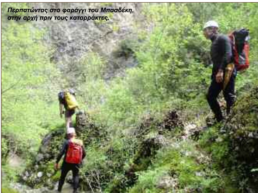
Περπατώντας στο φαράγγι του Μπασδέκη, στην αρχή πριν τους καταρράκτες.

Ο ποταμός Άραχθος πηγάζει στη Βόρεια Πίνδο, από το όρος Λάκμωνα (στη θέση Όξιά Δεσπότη) σε υψόμετρο 1.700μ. Περνά νότια του Μετσόβου