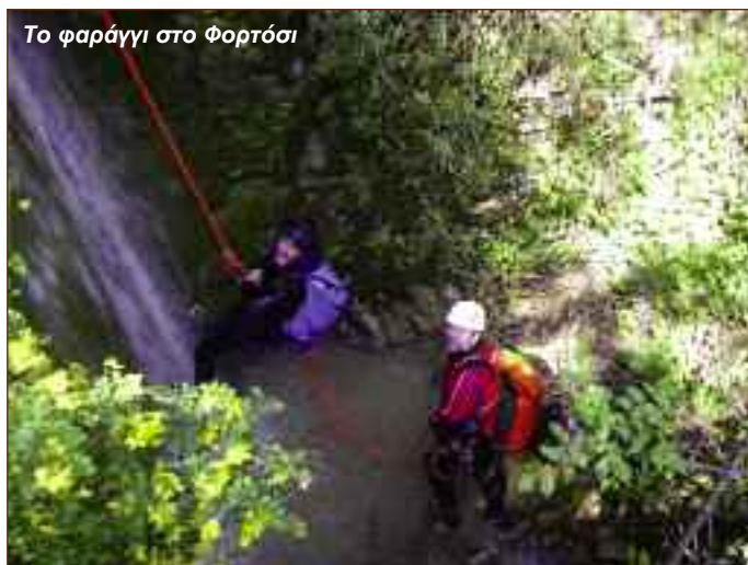
Το φαράγγι στο Φορτόσι

Πολύ κοντά στο Φορτόσι, βρίσκεται και το χωριό Καλέντζι. Μέσα στο χωριό υπάρχει ένας χωματόδρομος που κατεβαίνει στην περιοχή Κλίφκη του Αράχθου. Ο δρόμος είναι βατός για όλα τα αυτοκίνητα και δεν θα τον δείτε στους χάρτες που κυκλοφορούν. Το τέλος του δρόμου είναι πάνω σε ένα παλιό στριφογυριστό καλντερίμι, το οποίο έχει τοιμεντοστρωθεί και διαπλατυνθεί. Προορισμός του δρόμου είναι κάποιο σπήλαιο που εκβάλλει ένα υπόγειο ποτάμι και συμπωματικά βρίσκεται και η έξοδος του φαραγγιού με το όνομα Μπασοδέκης . Στην περιοχή αυτή που είναι λίγα μέτρα πάνω από τον Αραχθο, πρόκειται να γίνει και ένα μικρό υδροηλεκτρικό έργο λόγω της