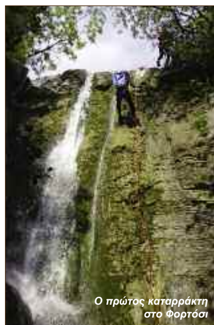
Ο πρώτος καταρράκτης στο Φορτόσι

Τα φαράγγια ασφαλίστηκαν στις 2 και 3 Μαΐου 2009 από τους Γιώργο Ανδρέου, Κώστα Μελέτη, Δημοσθένη Πατρώνα, Χρήστο Νικολάου, Κώστα Χρηστογιάννη και Μιχάλη Αράπη.