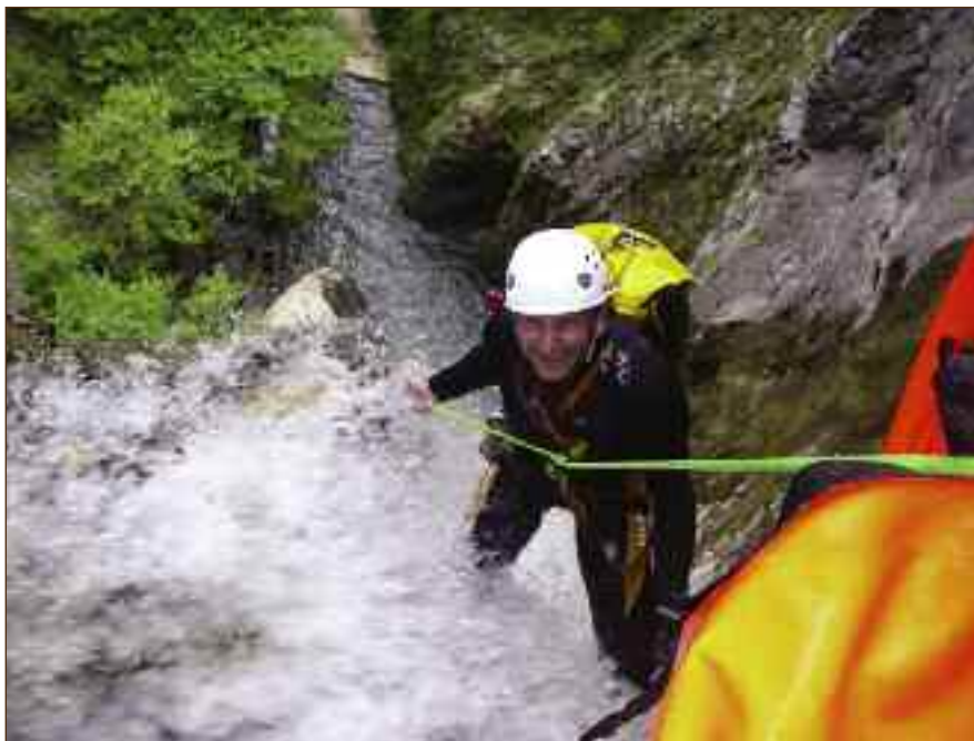
Ο μεγάλος καταρράκτης της Κλίφκης από επάνω.

Το γεφύρι της Πολιτσάς προσεγγίζεται από τα Γιάννενα περίπου σε μισή ώρα. Λίγο πριν το γεφύρι είναι το χωριό Φορτόσι. Μετά το χωριό κατεβαίνοντας για Άραχθο θα δούμε ένα μικρό και πολύ γραφικό φαράγγι που μάλιστα τέμνει τον ασφαλτόδρομο