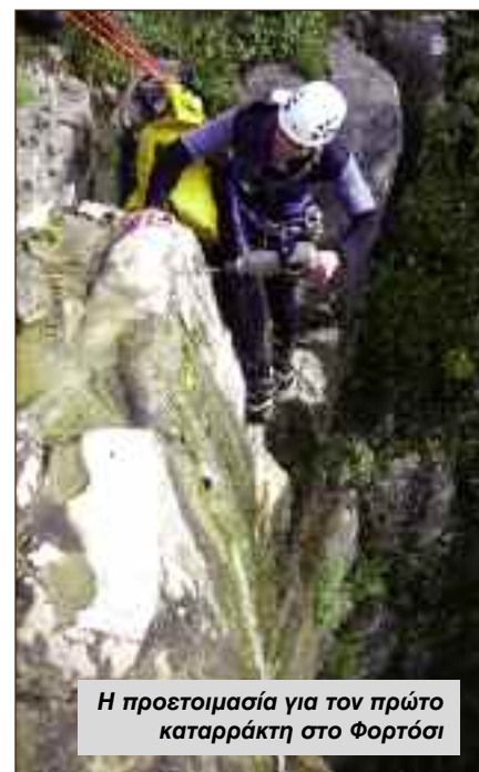
Η προετοιμασία για τον πρώτο καταρράκτη στο Φορτόσι