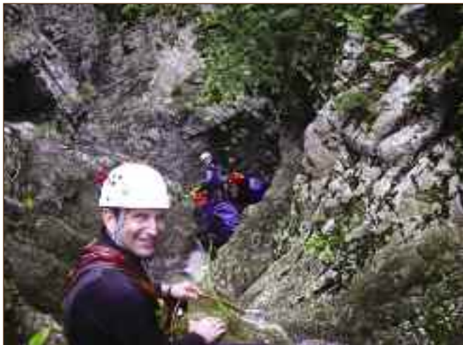
Φαράγγι Μπασδέκη λίγο πριν το στενό του πέρασμα.