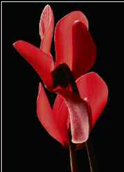
Το λουλούδι που γελά