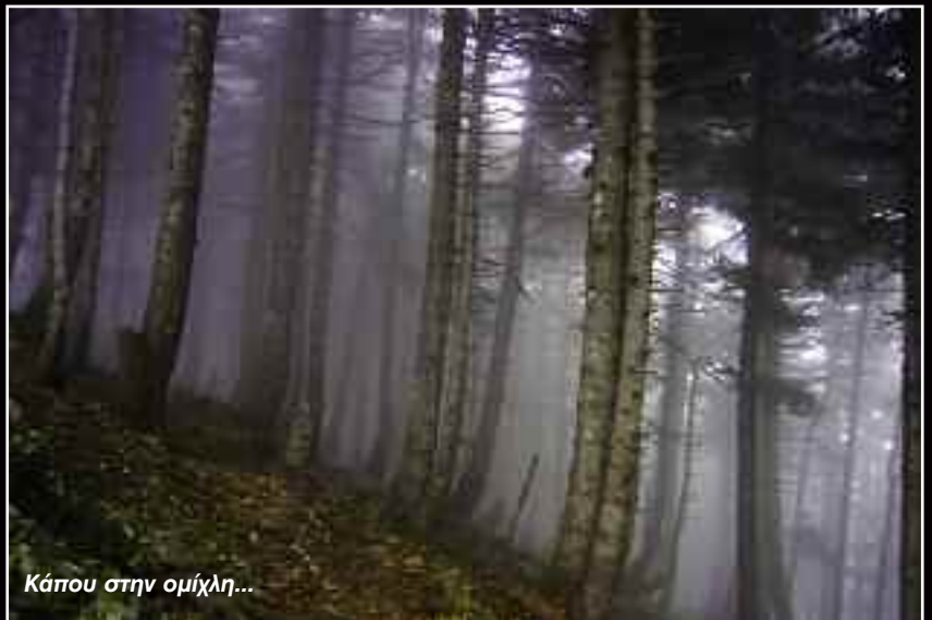
Κάπου στην ομίχλη...