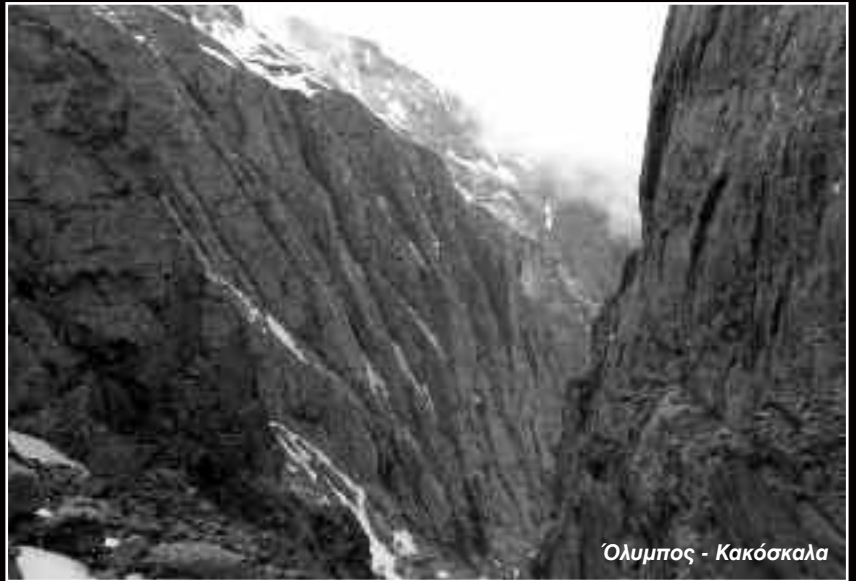
Όλυμπος - Κακόσκαλα