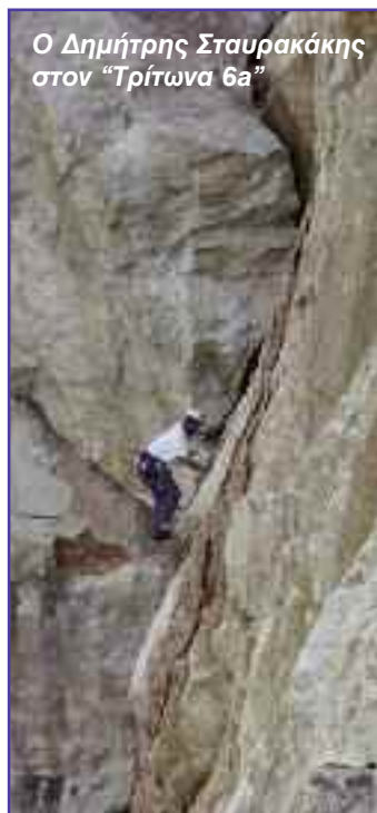
Ο Δημήτρης Σταυρακάκης στον “Τρίτωνα 6a”