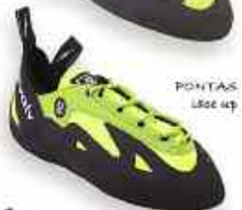
PONTAS LITE 4P