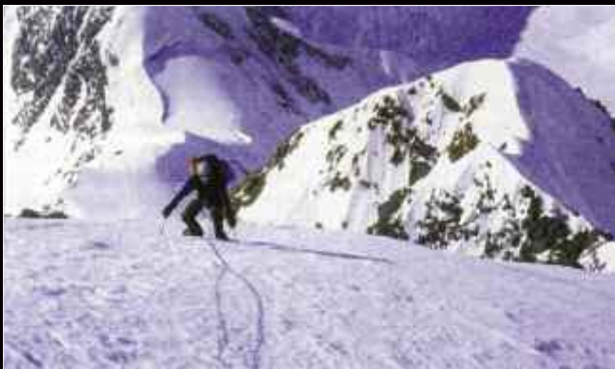
Ο Simon Yates στη Νοτιοδυτική Κόψη της Good Neighbor Peak.

Ο Paul Schweizer και ο περιβόητος αρνητικός πρωταγωνιστής του Touching the Void, Simon Yates (όλοι πλέον έχουν δει την ταινία ή έχουν διαβάσει το βιβλίο της επικής περιπέτειας των Simpson και Yates στη Siula Grande το 1985), ένωσαν τις δυνάμεις τους και κατάφεραν την πρώτη αλπικού στυλ και μόλις δεύτερη ανάβαση της τεράστιας Νοτιοδυτικής Κόψης της Good Neighbor Peak (4850μ) στη Νότια Κορυφή του Mt. Vancouver (σύνορα Καναδά- Αλάσκας). Η σχοινοσυντροφία αερομεταφέρθηκε (συνήθης πλέον τακτική για τις περισσότερες ομάδες) από το Haines στο base camp του βουνού, μόλις 30 λεπτά από το στόχο τους, την τεράστια αυτή κόψη (2400μ. υψομετρική) που ορίζει τα σύνορα των δύο χωρών. Δύο μέρες μετά, με άψογο καιρό, ξεκίνησαν την προσπάθειά τους, φτάνοντας στην κορφή μετά από άλλες επιπλέον τέσσερις ημέρες, καλύπτοντας 3000 μέτρα αναρρίχησης, με γενική δυσκολία ED και σχοινιές Scottish 5 και μεικτά θου βαθμού. Το πλάνο τους μετά ήταν να κατεβούν την κλασική διαδρομή στο Νοτιοανατολικό Σπηρούνι (1967) αλλά μια δυνατή κακοκαιρία τους καθήλωσε για μια μέρα, αναγκάζοντάς τους σε αλλαγή σχεδίου. Τελικά αναγκάστηκαν να καταρριχθθούν στο μεγαλύτερο μέρος της Ανατολικής Κόψης, πριν με μερικά ακόμη περιπετειώδη ραπέλ, πατή-