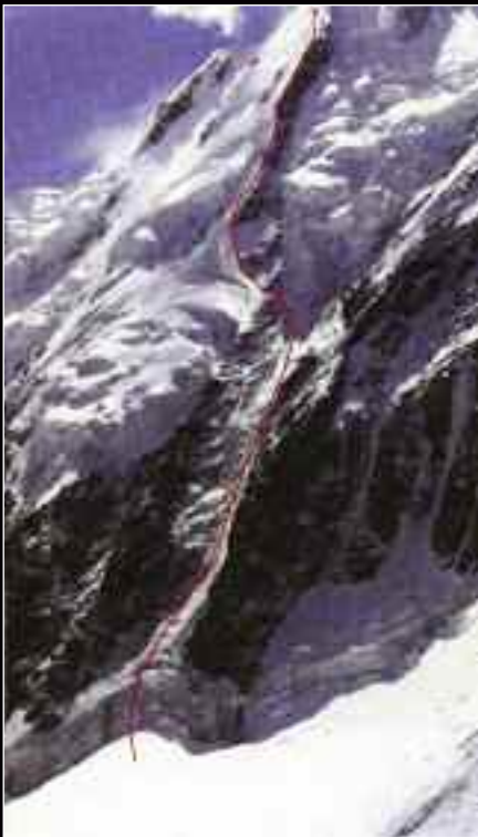
Η "Sweet 65" στο βορειοδυτικό πιλιέ της Koh-e-Uparisina. (επάνω)

Η μοιραία ασκαρφάλωτη Νοτιοανατολική ορθοπλαγιά του Edgar. (αριστερά)