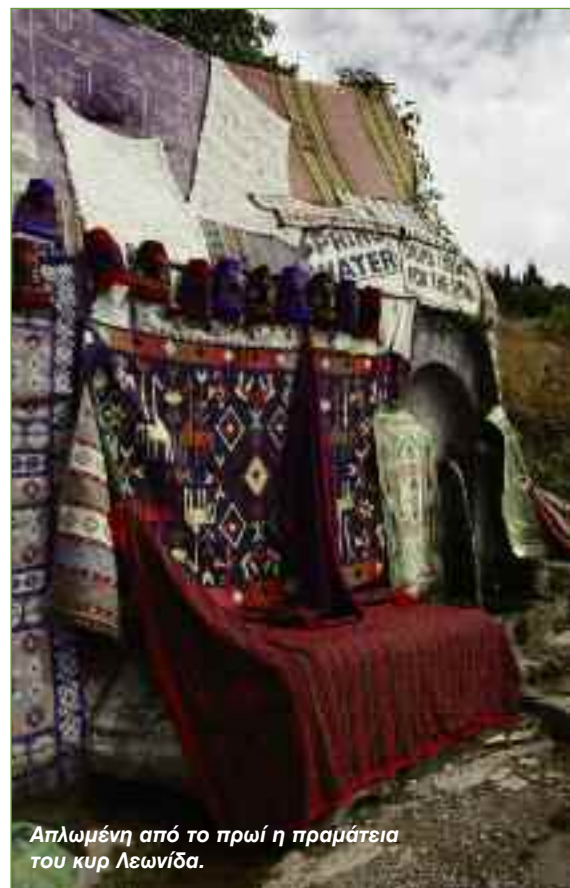
Απλωμένη από το πρωί ηπραμάτεια του κυρ Λεωνίδα.