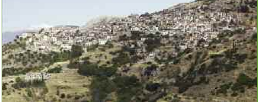
Σε υψόμετρο 1070 μέτρων σκαρφαλώνει στις πλαγιές του Παρνασσού η πόλη της Αράχωβας.