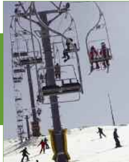
Αναβατήρες λειτουργούν για την εξυπηρέτηση των χιονοδρόμων.