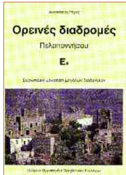
Το βιβλίο του, «ορεινές διαδρομές Πελοποννήσου Ε4» στα Ελληνικά, Αγγλικά, Γερμανικά.

Η καριέρα του στην οδοσήμανση αρχίζει συμπτωματικά στις αρχές της δεκαετίας του 80. Η διοίκηση της ΕΟΧΟ βρίσκει επιτυχημένη μια οδοσήμανση που είχε κάνει για προσωπική χρήση στην Παληοβούνα του Λουτρακίου και του αναθέτει τη