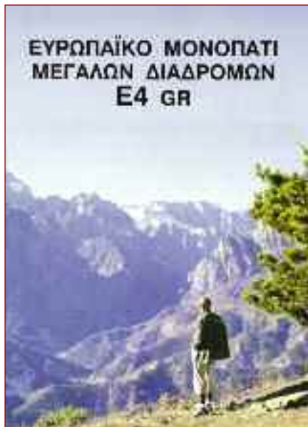
Το πολύπτυχο του μονοπατιού Ε4 που συντάχθηκε από τον Τάσο Ρήγα και εκδόθηκε από τον Ε.Ο.Τ.

ται μαζί με το υπόλοιπο προσωπικό της ΑΕΤΕ στο νέο Οργανισμό. Το Μάιο του 1967 αναγκάζεται να παρατηθεί από τη θέση του σε ηλικία 53 ετών, για ν' αποφύγει τις διώξεις της Χούντας των συνταγματαρχών και συνταξιοδοτείται. Επειδή το όνομά του είναι γνωστό στην αγορά εργασίας προσλαμβάνεται αμέσως από γερμανική εταιρία τηλεπικοινωνιακού υλικού όπου παραμένει ως τεχνικός διευθυντής ως την 31.12.1980, οπότε απολύεται διότι έχει καταληφθεί από το όριο ηλικίας.