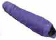
- ΚΛΑΣΙΚ 700