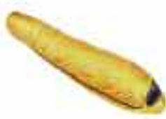
- ΠΕΤΙΛΙΝ 800