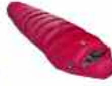
- ΣΤΑΙΝ ΙΣΤ 8