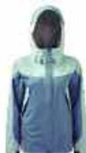
- ΑΜΗ ΔΑΒΛΑΜ ΟΥΣ