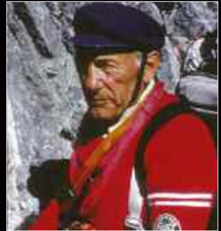
Ο μεγάλος Riccardo Cassin ένας από τους μεγαλύτερους ορειβάτες όλων των εποχών.

στις Grandes Jorasses το 1938, το απόλυτο αλπικό όνειρο, σύμφωνα με τον Gaston Rebuffat. Στη διάρκεια του Β' Παγκοσμίου Πολέμου, αντιτάχθηκε απέναντι στους φασίστες του Μουσολίνι, και πολέμησε σαν παρτιζάνος, χάνοντας στη μάχη μπροστά στα μάτια του, φίλους του, όπως ο Vittorio Ratti (με τον οποίο άνοιξε πολλές διαδρομές). Μετά τον Πόλεμο ο Cassin οδήγησε πολλές αποστολές στα Ιμαλάια, τη Νότια Αμερική και την Αλάσκα. Ήταν ο ηγέτης της πρώτης επιτυχημένης Ιταλικής αποστολής στο Gasherbrum IV το 1958, ενώ το 1961 στα 52 του, οδήγησε άλλους 5 συνορειβάτες του, στη μακριά Νοτιοανατολική Κόψη του Denali, που σήμερα φέρει το όνομά του. Πάντα σκαρφάλωνα με ταπεινότητα απέναντι στο βουνό, είτε στο Climbing, ένα χρόνο πριν πεθάνει, γι' αυτό ίσως τα βουνά έγιναν φίλοι μου και δεν έβλαψαν ποτέ, ούτε τους φίλους μου, ούτε εμένα. Πίσω στο 1987, στη Βορεινή του Badile, ο Salvaterra, προσφέρθηκε να απαλλάξει τον Cassin από το βάρος του σακιδίου του, αλλά αυτός αρνήθηκε, λέγοντας ότι το σακιδίό του είναι μέρος του εαυτού του, όταν βρίσκεται στο βουνό. Όταν στράφηκε να τον χαιρετήσει, ο Cassin σήκωσε τα χέρια του και ανταπέδωσε ένα σιωπηλό