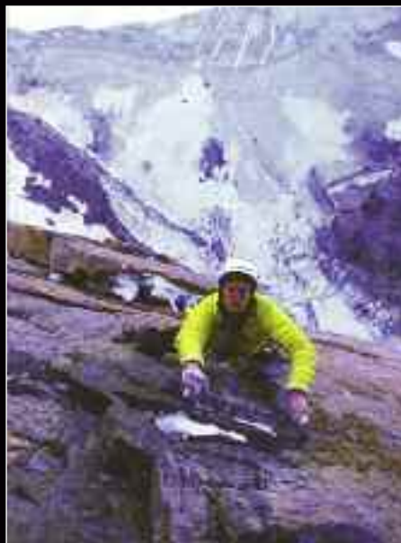
Ο Leo Houlding στη βορειοδυτική ορθοπλαγιά του Mt. Asgard.

Θρυλικός Αμερικανός αναρριχητής John Bachar, σκοτώθηκε σε μια από τις συνηθισμένες σόλο διαδρομές που τον καθιέρωσαν, στο Dike Wall της California. Γιος Μαθηματικού, εγκατέλειψε πολύ νωρίς το σχολείο για να ασχοληθεί αποκλειστικά με το σκαρφάλωμα. Γνωστός για τα απίστευτα σόλο του (Moratorium, Nabsisco Wall, Butterballs) εισήγαγε στην αναρρίχηση τις μεθόδους της συστηματικής προπόνησης και της γυμναστικής τεχνικής. Το 1981, μαζί με τον Dave Yerian, άνοιξαν την περιβόητη και επικίνδυνη Bachar-Yerian Route στα Tuolumne Meadows, ενώ το 1986 τάραξε τα νερά της παγκόσμιας αναρρίχησης, όταν μαζί με τον Peter Croft, σκαρφάλωσαν για πρώτη φορά σε 14 ώρες συνολικά, την El Capitan και την Half Dome, ένα τρελό επίτευγμα για την εποχή. Ήταν επίσης υπεύθυνος (μαζί με τον Ron Kauk) για ένα από τα διασημότερα boulder προβλήματα στον κόσμο, το Midnight Lighting (V8) στο Yosemite. Πέρα από τα τρελά του σόλο, θα τον θυμόμαστε επίσης, για την αγνή του αφοσίωση στην καθαρή αναρρίχηση και για την πολεμική του, απέναντι στην πρακτική των βυσμάτων χωρίς μέτρο, που κατέκλυσαν τις ορθοπλαγιές, τη δεκαετία του 80. Έφυγε στα 52 του χρόνια, αφήνοντας πίσω του εκτός από τη βαριά του κληρονομιά και ένα γιο τον Tygus.