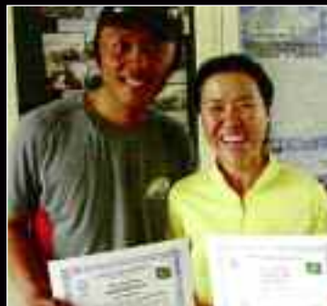
Η Oh Eun-Sun και ο σύντροφός της Cheol Kim-Jong.

Η Κορεάτισα Oh Eun Sun, βρίσκεται πολύ κοντά στο να γίνει η πρώτη γυναίκα που θα καταφέρει το περίφημο Grand Slam, δηλαδή την ανάβαση των 14 θάρων κορυφών του κόσμου. 43 ετών πια, ξεκίνησε την εντυπωσιακή πορεία της το 1997, σκαρφαλώνοντας την πρώτη της κορυφή με το μαγικό υψόμετρο, πρόσθεσε όμως μόλις 2 θάρους στο ενεργητικό της, για τα επόμενα 10 χρόνια. Το 2007 σοβαρεύτηκε εντείνοντας τις προσπάθειές της για το πολυπόθητο επίτευγμα, που πρώτος είχε καταφέρει ο μυθικός Reinhold Messner το 1986, καταφέροντας 2 κορυφές σε μια χρονιά. Το 2008 κατάφερε άλλες 4 θάρους, ενώ ως τώρα μέσα στο 2009, έχει καταφέρει άλλες 4. Kangchenjunga, Dhaulagiri, Nanga Parbat και τον Αύγουστο, Gasherbrum I. Αυτή τη στιγμή (φθινόπωρο) δοκιμάζει την τελευταία και πιο δύσκολη ίσως πρόκληση του εγχειρήματος, την Annapurna. Ποιες είναι όμως οι ανταγωνίστριες που την κοντράρουν, σε αυτό το σκληρό μαραθώνιο; Η Αυστριακή Gerlinde Kaltenbrunner, η Ιταλίδα Nives Meroi και η Ισπανίδα Edurne Pasaban. Όπως η Oh, έτσι και οι τρεις υποψήφιες για τον τίτλο, έχουν δουλέψει μεθοδικά και σκληρά για το όνειρό τους. Η Meroi έχει σκαρφαλώσει 11 κορυφές ενώ οι Pasaban και Kaltenbrunner έχουν καταφέρει 12. Η τελευταία μάλιστα υποχώρησε στα 8300 μέτρα (πάνω από το Bottleneck) στην προσπάθειά της στο K2, αυτό το καλοκαίρι. Αν τα καταφέρει την επόμενη φο-