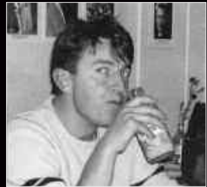
Ο Tomaz Humar σε μια από τις τελευταίες του φωτογραφίες.

τον προστατεύουν πνεύματα και αν συνεχίσει να σκαρφαλώνει έτσι, σύντομα θα συναντήσει αληθινά φαντάσματα ή θα συνεχίσει να έχει με το μέρος του, τη φοβερή του τύχη». Δυστυχώς η τελευταία τον εγκατέλειψε, στο τελευταίο του ταξίδι στα Ιμαλία, στην προσπάθειά του να ανοίξει μια νέα γραμμή στο απομονωμένο Langtang Himal (Nepal). Μετά από μια πτώση, τραυματισμένος, καθελώθηκε στα 5300 μέτρα και υπέκυψε στις κακοτυχίες και την κακοκαιρία, πριν το ελικόπτερο, που έφτασε τελικά, εντοπίσει το άψυχο παγωμένο σώμα του. Το τελευταίο μεγάλο του επίτευγμα, με το οποίο είχε αποκαταστήσει κάποιο μέρος από την αμφισβητούμενη αξιοπιστία του, στάθηκε τελικά να είναι το αψόγου στυλ σόλο του, στη Νότια της Annapurna. Το όνομά του πάντως, έρχεται να προστεθεί στην καταραμένη λίστα των κορυφαίων Σλοβένων Αλπινιστών, που χάθηκαν πρόωρα στα βουνά του κόσμου (Jeglic-Svetičic-Zaplotnik-Belak-Pockar- Petrik)