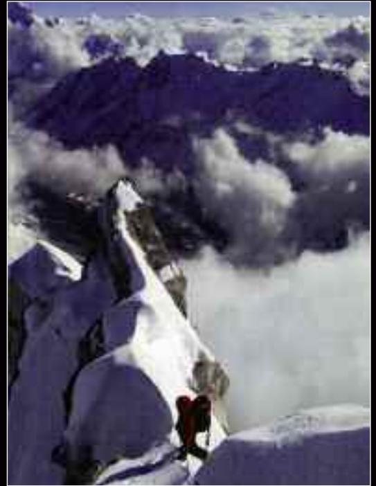
O Yannick Graziani στη Νότια ορθοπλαγιά του Nemjung

Κορεάτης Mr. Park, άνοιξε μια νέα διαδρομή στη Νοτιοδυτική ορθοπλαγιά, μια διαδρομή που κανονικά θα ήταν η είδηση της χρονιάς, αν δεν χρησιμοποιούσε τακτικές από το παρελθόν (σταθερά σχοινιά- ενδιάμεσα camp-οξυγόνο). Μέσα στο 2009, τέσσερις ορειβάτες ολοκλήρωσαν το Grand Slam, φτάνοντας τον αριθμό των ανθρώπων που το έχουν καταφέρει, στους 18! Πότε θα σταματήσουμε να μετράμε, θα πρέπει κάποτε να στρέψουμε την προσοχή μας, στην ποιότητα των διαδρομών που σκαφαλώνουμε. Τα πρώτα μέλη της λίστας με τις 14 θάρες κορυφές, ήταν ορειβάτες όπως ο Messner, ο Kukuczka και ο Loretan, οι οποίοι τα κατάφεραν σε εξαιρετο αλπικό στυλ, από νέες διαδρομές και με μια διάθεση να εξερευνηθούν τα απροσδιόριστα όρια των ανθρώπινων δυνατοτήτων στον αλπινισμό. Σήμερα οι επίδοξοι διεκδικητές του τίτλου, περιορίζονται στη στείρα επανάληψη των κλασικών γραμμών, με όλα τα παρελκόμενα (κλασικό στυλ των μεγάλων ή εμπορικών αποστολών). Γι' αυτό και η επιτυχία των τεσσάρων αυτών ορειβατών φέτος, μοιάζει με ένα πιάτο ξαναζεσταμένου φαγητού, μπροστά στην εμβέλεια των διαδρομών που σκαφαλώθηκαν στις χαμηλότερες κορυφές, από νέους ορειβάτες με όραμα και την υπόσχεση να πάνε τα πράγματα ένα μεγάλο βήμα εμπρός.