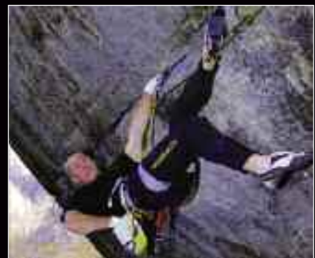
Ο Stevie Haston στην Greenspit (F8b+).

αυτό που αγαπάς, μπορούν πάντα να σε φέρουν στην κορυφή του σπορ, ακόμη και αν διανύεις την 5η δεκαετία της ζωής σου. Ο Stevie Haston πάντως δεν έδειξε να εντυπωσιάζεται και τόσο από την επίδοσή του. Ήμουν τυχερός, είπε καταλήγοντας, ο κόσμος ούτε άλλαξε, ούτε ταρακουνήθηκε εξαιτίας μου και απέχω ακόμη 2 βαθμούς από το σημερινό όριο της αναρρίχησης. Άρα έχω πολλή δουλειά μπροστά μου.