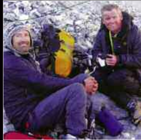
Πάνω. Η Νότια ορθοπλαγιά του Mera Peak.