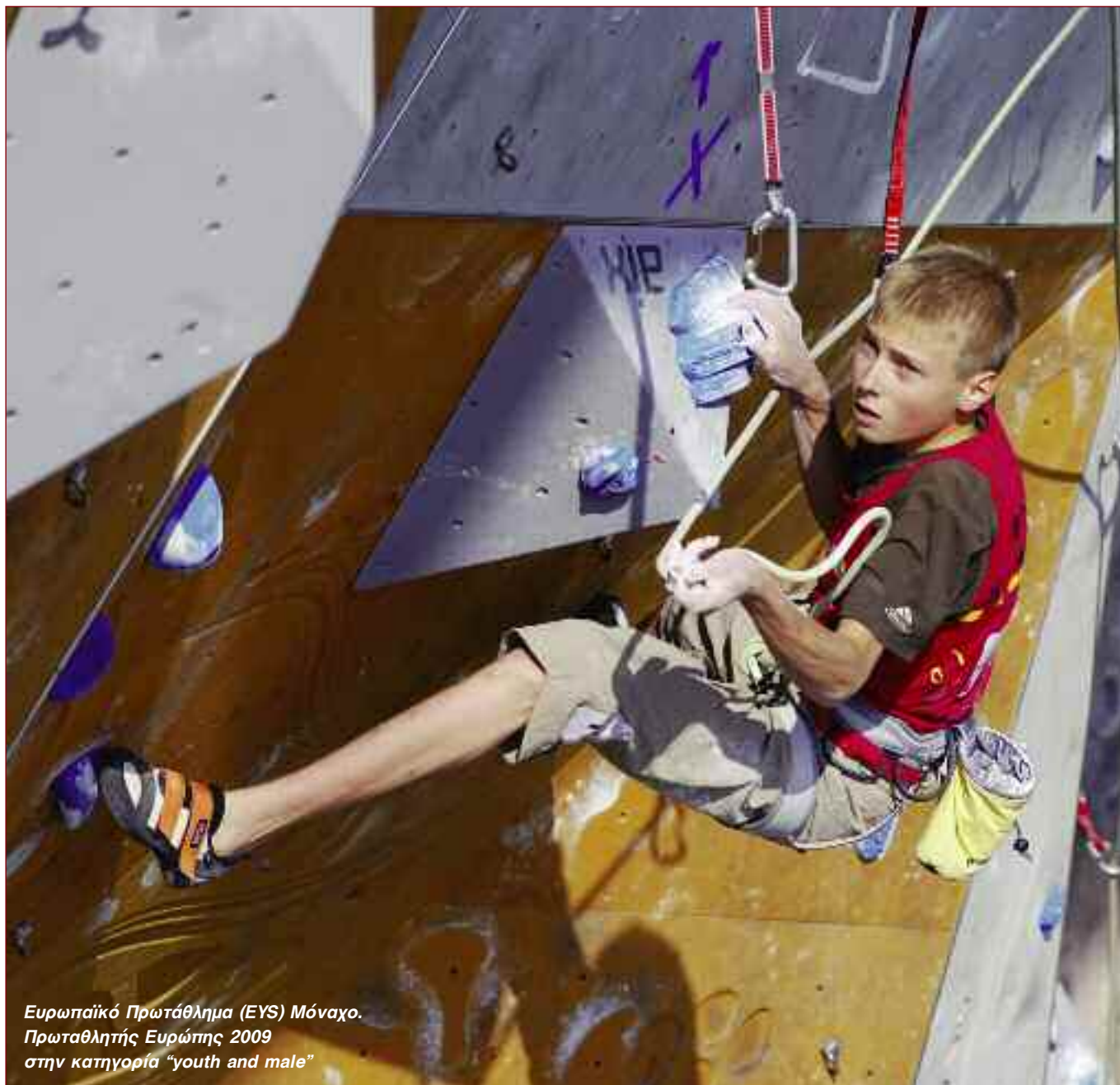
Ευρωπαϊκό Πρωτάθλημα (EYS) Μόναχο. Πρωταθλητής Ευρώπης 2009 στην κατηγορία "youth and male"

Θωμάς: Αν δε σε ενδιέφερε η αγωνιστική αναρρίχηση και σκαρφάλωνες μόνο στο βράχο θα έκανες άλλου είδους προπόνηση για να ανεβάσεις επίπεδο;