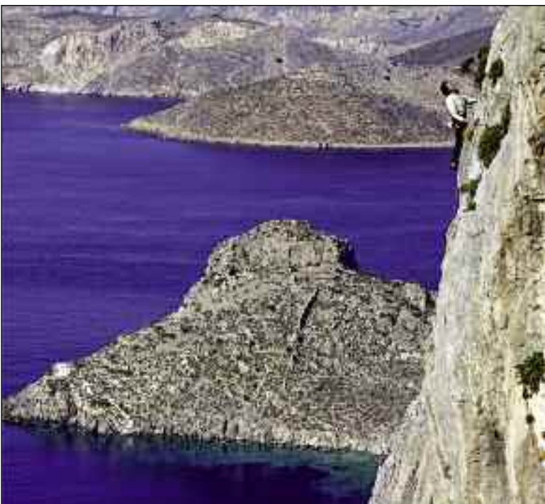
Κάλυμνος. Αναρρίχηση στο πεδίο Ιλιάδα.

Από το 1964 οι ορειβάτες έχουν τη δυνατότητα να αναζητούν το Σήμα Ασφαλείας της UIAA όταν αγοράζουν ορειβατικό εξοπλισμό. Το σήμα ασφαλείας σημαίνει ότι ο εξοπλισμός έχει περάσει τους πιο αυστηρούς ελέγχους. Επίσης, από το 2004 η UIAA επιβραβεύει με το Περιβαλλοντικό Σήμα όσους ακολουθούν τις περιβαλλοντικές της οδηγίες κατά την οργάνωση των ορειβατικών τους δραστηριοτήτων.