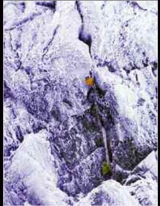
Η νότια ορθοπλαγιά του Siguniang με τη διαδρομή The free Spirits.

νώντας από την πόλη του Rilong, με 15 κιλά σακίδια και λίγο πριν τον ερχομό του χειμώνα, προσπέρασαν τη ριμή της ορθοπλαγιάς και κινήθηκαν γρήγορα χωρίς σχοινιά, μέχρι το πρώτο βίνουας στα 5700 μέτρα. Την επομένη αφού ξεπέρασαν τέσσερις σχοινιές μεικτού σκαρφαλώματος και αρκετά βράχια εμπόδια, βγήκαν στην κορφή αργά το απόγευμα, νιώθοντας ελεύθερα πνεύματα, πράγμα που έδωσε και το όνομα της διαδρομής, Free Spirits. Η Κινεζική ορειβασία ήταν ανέκαθεν παραδοσιακή, με μεγάλες αποστολές που γαζώνουν τις ορθοπλαγιές με σταθερά σχοινιά και πολλές κατασκηνώσεις, κατά συνέπεια ο αλπινισμός με την έννοια του καθαρού αλπικού στυλ, ήταν άγνωστος στην πλειονότητα των Κινέζων ορειβατών, μέχρι την χρονιά που οι Zhou και Yan, άρχισαν να σκαρφαλώνουν στο πανεπιστήμιο και συναναστράφηκαν με δυτικούς ορειβάτες. Ήταν και οι δύο τους στην Everest Olympic Torch Expedition, όπως επίσης και στην ομάδα που ανέσυρε τα σώματα των Jonny Copp και Wade Johnson, έπειτα από την τραγική προσπάθειά τους, σε κάποια κορυφή του Sichuan, το 2009. Ο Yan πρόσφατα άρχισε να συλλέγει εμπειρίες σκαρφαλώνοντας με ορειβάτες, όπως ο Σκωτσέζος Bruce Norman και ο Νεοζηλανδός Guy Mc Kinnon.