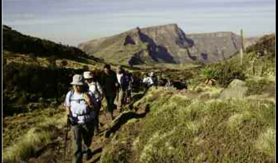
Η Μαρία Δαμβακεράκη στην κεφαλή της πορείας προς το Chenec. Πίσω της διακρίνονται η Μαρία Νταλέ και η Λένα Διβάνη.

της ρευστής, διάπυρης λάβας (πάχος πάνω από 3000μ), που κάλυψε την περιοχή. Με τον καιρό διαβρώθηκε ο σκληρός τους πυρήνας, υποχώρησε το κεντρικό τμήμα του ηφαιστειακού τους κώνου και σχηματίστηκε ένα τεράστιο καζάνι, μια καλντέρα όπως διεθνώς ονομάζεται. Στα τοιχώματα και τον πυθμένα της αναδύθηκαν πίνακες απαράμιλλης φυσικής ομορφιάς. Τα ορεινά και τα πεδινά τμήματα, οι βαθιές χαράδρες, τα απόκρημνα φαράγγια και οι βραχώδεις πυργοειδείς σχηματισμοί, που θυμίζουν Μιετώρα, αποτελούν τα άψυχα κομμάτια ενός παζλ που μαζί με το έμφυχο συμπλήρωμά τους, τα χωριά, τους κατοί-