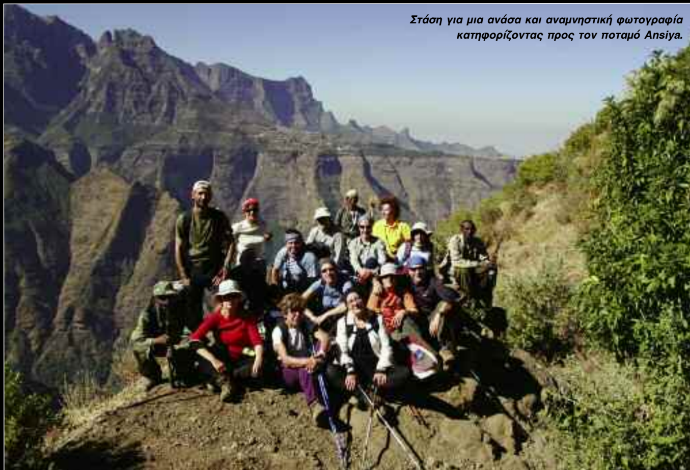
Στάση για μια ανάσα και αναμνηστική φωτογραφία κατηφορίζοντας προς τον ποταμό Ansiya.