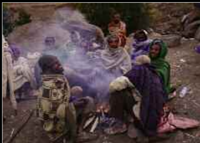
Ομάδα μουλαράδων προσπαθεί να αμυνθεί στο πρωινό δρυμό ψύχους στην κατασκήνωση Ambico.

μουλάρια και κινούσαν για την επόμενη μας κατασκήνωση, το Geesh, όπου το ίδιο βράδυ θα ξαναταμιάναμε.