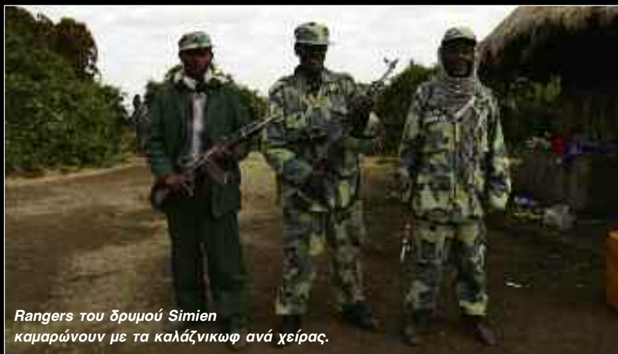
Rangers του δρυμού Simien καμαρώνουν με τα καλάζνικωφ ανά χείρας.

Ο -μορφιά σε μεγάλες δόσεις από παντού. Τα βουνά ήταν τα ωραιότερα που έχω δει στη ζωή μου -η θέα σου έκοβε κυριολεκτικά την ανάσα μερικές φορές (άμα σου είχα μείνει ανάσα απ' το υψόμετρο φυσικά...) Οι Αιθίοπες, γυναίκες, άντρες και παιδιά, είναι πολύ ωραία ράτσα. Αν είχαν λίγο φαγάκι και κανένα ρουχαλάκι παραπάνω θα νομίζαμε πως βρισκόμασταν στην εκπομπή next top model!!!