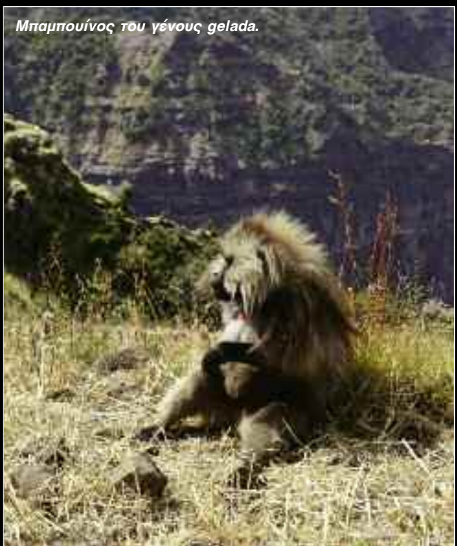
Μπαμπούνος του γένους gelada.