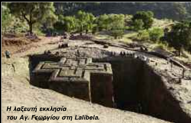
Η λαξευτή εκκλησία του Αγ. Γεωργίου στη Lalibela.

Π -όλεις όμορφες δεν είδαμε. Η φτώχεια τα χει ρημάξει όλα. Ακόμα και η τουριστική κτάτη Λαλίμπελα, η Μέκκα των αφρικανών, τα χάλια της έχει!