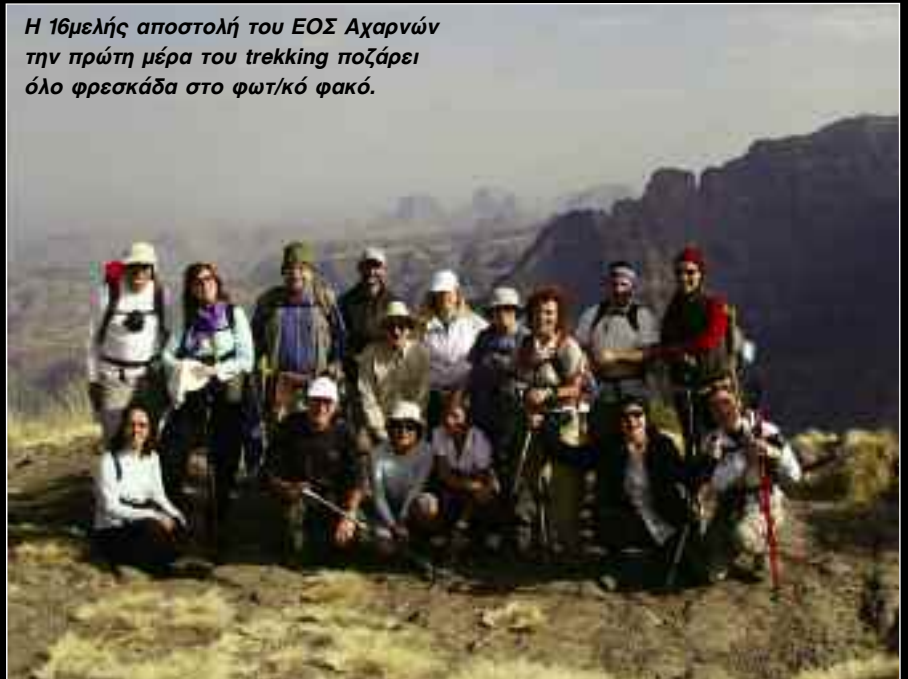
Η 16μελής αποστολή του ΕΟΣ Αχαρνών την πρώτη μέρα του trekking ποζάρει όλο φρεσκάδα στο φωτικό φακό.

Τέλος, ευχαριστώ τον ΕΟΣ Αχαρνών που μου εμπιστεύτηκε την αρχιγία αυτής της αποστολής.