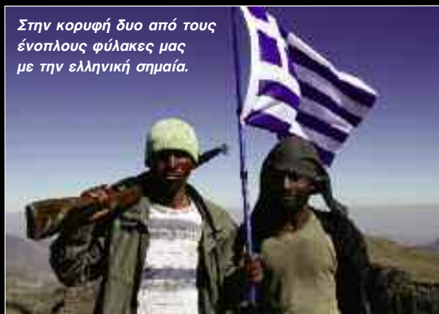
Στην κορυφή δυο από τους ένοπλους φύλακες μας με την ελληνική σημαία.

Όσο κουραστική ήταν η δεύτερή μας ημέρα στα βουνά, άλλο τόσο ενδιαφέρουσα υπήρξε. Ανηφορήσαμε αρκετά προκειμένου να σκαρφαλώσουμε στο ύψωμα Emet Gogo,