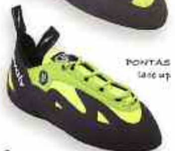
PONTAS last up