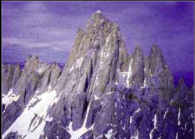
Το Συγκρότημα του Fitz Roy από τα βορειοδυτικά.