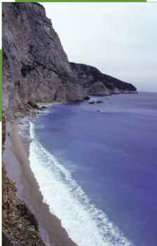
Το Πόρτο Κασίκι. Η φύση ζωγραφίζει.

Περπατώντας στα καντούνια της πόλης συναντάς το μικρό ιδιωτικό μουσείο του φωνόγραφου. Αξίζει να χαζέψεις τα σπάνια πια εκθέματά του. Εκεί όμως, που αξίζει να σταθεί κάποιος περισσότερο χρόνο είναι στο Αρχαιολογικό Μουσείο Λευκάδας. Μπροστά στα αρχαιολογικά ευρήματα ξεδιπλώνεται η πανάρχαια ιστορία του νησιού. Τα ευρήματα περιλαμβάνουν μια μεγάλη περίοδο. Από την Παλαιολιθική εποχή μέχρι τη Ρωμαϊκρατία.