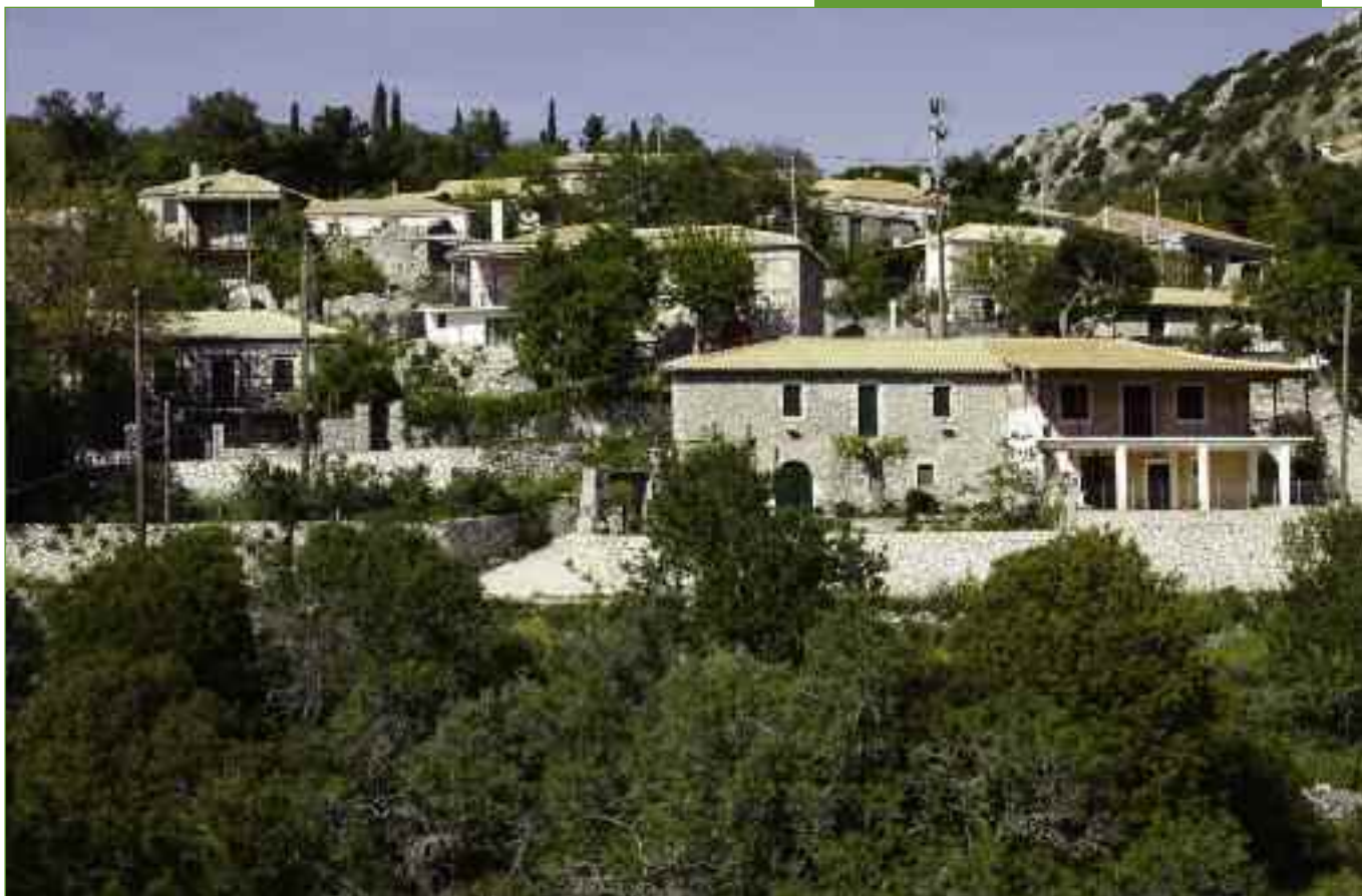
Δρυμώνας. Ένα χωριό που ξεχωρίζει στα ορεινά για την αρχιτεκτονική του.