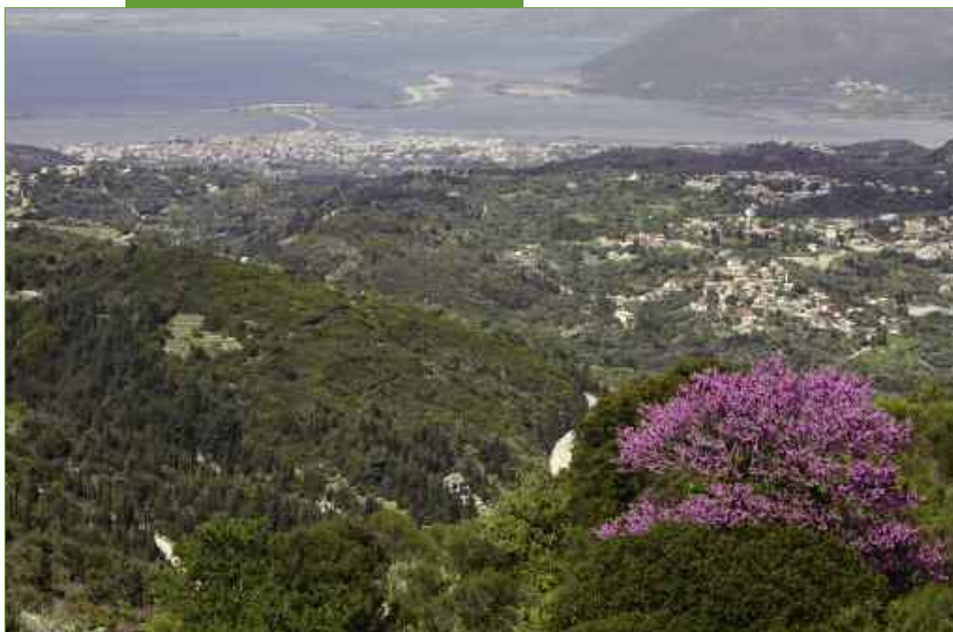
Ο ελαιώνας και η πόλη της Λευκάδας.

Μπροστά από το Νυδρί απλώνονται καταπράσινα νησάκια. Η Μαδουρή, ο Σκορπιός, η Σπάρτη, το Σκορπίδι, το Μεγανήσι.