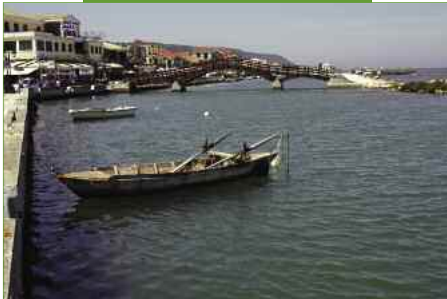
Η παραλιακή διαδρομή στην πρωτεύουσα

Άλλοτε το νησί ενωνόταν με την ακτή της Δυτικής Στερεάς Ελλάδας, μάλιστα συγγραφείς όπως ο Στράβωνας και ο Παισαίνιος αναφέρουν τη Λευκάδα ως χερσόνησο που συνδεόταν με την Ακαρνανία διά ισθμού. Σύμφωνα με μαρτυρίες οι Κορίνθιοι όταν τον 7ο αιώνα π.Χ. κατέλαβαν τη Λευκάδα έκοψαν τον Ισθμό και έτσι μετέβαλαν τη χερσόνησο σε νησί. Ανέκαθεν λοιπόν υπήρχε ένα στενό πέρασμα στο βορειο-ανατολικό μέρος του νησιού που επικοινωνούσε με την ηπειρωτική Ελλάδα. Γι' αυτό και κτίστηκε εκεί φρούριο, με σκοπό να προστατεύει το νησί από επιδρομές. Το κάστρο που σώζεται μέχρι τις μέρες μας λέγεται «Της Αγίας Μαύρας». Είναι φράγκικο και ο αρχικός πυρήνας του είναι το 13ο αιώνα. Το 1204 το νησί ενσωματώθηκε στο Δεσποτάτο της Ηπείρου και το 1294 ο Δεσπότης Νικηφόρος Α΄ πάντρεψε την κόρη του Μαρία με τον Ιωάννη Α΄ Οροίνι, δίνοντάς της για προίκα τη Λευκάδα. Έτσι ο Ιωάννης Α΄ έχτισε τον πυρήνα του κάστρου, που αποτελεί σήμερα ζωντανό κομμάτι της ιστορίας του νησιού. Ο Κάρολος Α΄ Τόκκος το μεγάλωσε αργότερα κτίζοντας δεύτερους τοίχους παράλληλους στις εξωτερικές πλευρές του φρουρίου. Όμως το φρούριο δεν έμεινε παρά πολύ στην κυριότητα των Τόκκων. Το 1479 ο τουρκικός στόλος κατέλαβε το νησί, όμως γύρω στα 1500 περνά προσωρινά στη βενετική κυριαρχία. Μέχρι το 1810, που οι Άγγλοι την ενσωματώνουν στο κράτος των Ιονίων Νήσων, η Λευκάδα γνώρισε πολλούς «προστάτες». Την Άνοιξη του 1864 μέσα σε λαμπρή τελετή τελείωσε η αγγλική προστασία του νησιού και των Επτανήσων με την προσάρτησή τους στη μητέρα Ελλάδα.