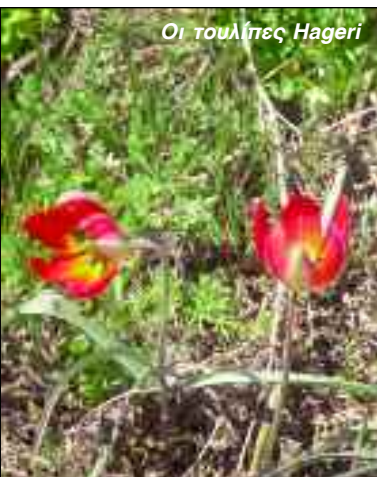
Οι τουλίπες Hageri