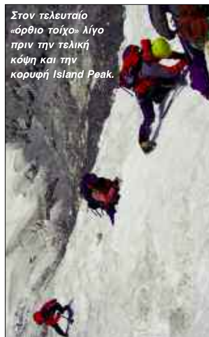
Στον τελευταίο «όρθιο τοίχο» λίγο πριν την τελική κόψη και την κορυφή Island Peak.

Οι Αγγιώτες ορειβάτες ευχαριστούν για τη στήριξη το Δήμο Αγριάς και το κοινωφελές Ίδρυμα Νικολάου και Ελένης Πορφυρογένη.