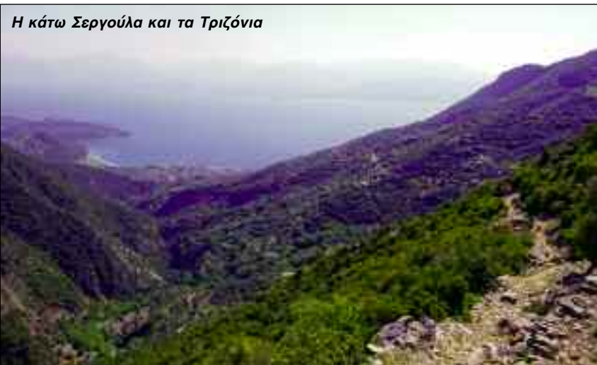
Η κάτω Σεργούλα και τα Τριζόνια

Διάρκεια πορείας: 8 ώρες, υψομετρική διαφορά ανάβασης από την Ποτιδάνεια σχεδόν 900 μ. και κατάβασης προς Σεργούλα, κατά τι περισσότερο.