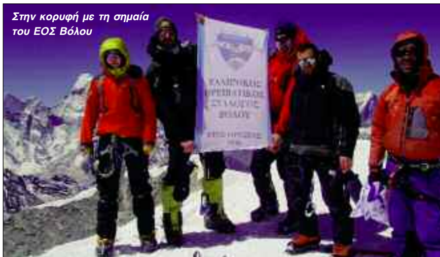
Στην κορυφή με τη σημαία του ΕΟΣ Βόλου