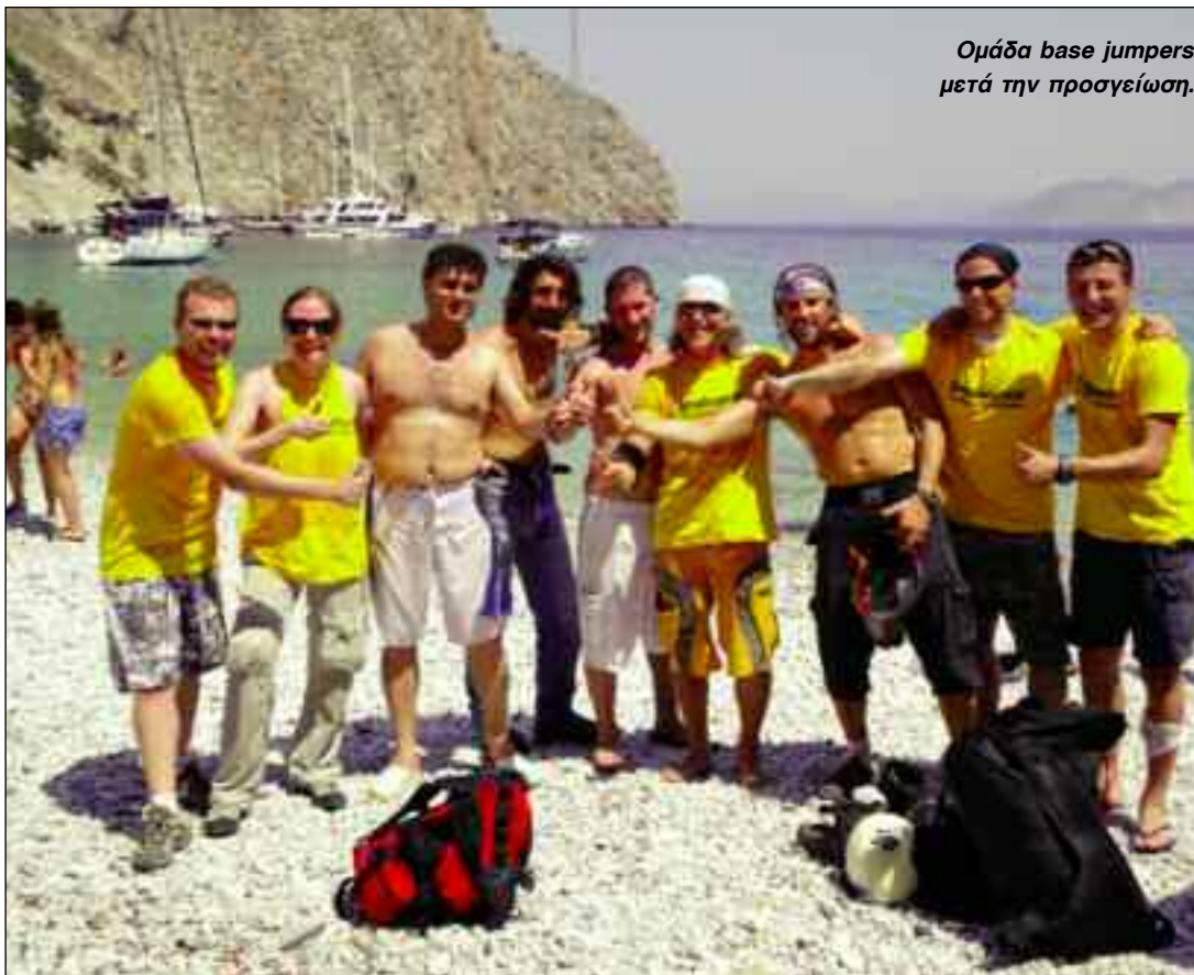
Ομάδα base jumpers μετά την προσγείωση.