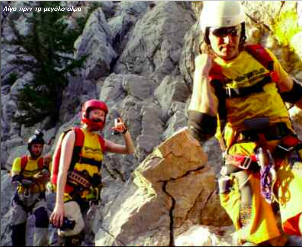
Λίγο πριν το μεγάλο άλμα