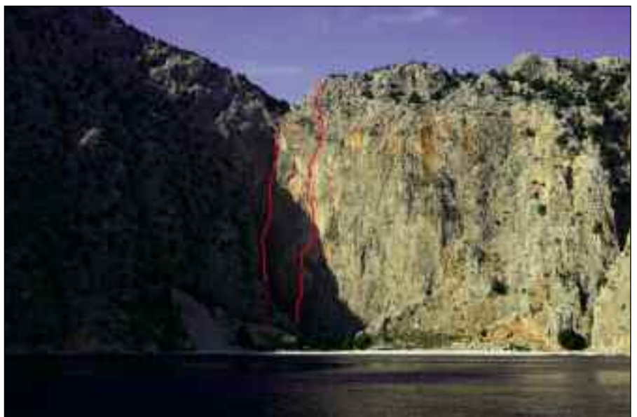
Η άγριας ομορφιάς παραλία του Άη Γιώργη του Δυσάλωτου. Αριστερά η χάραξη του «Νηρέα» και δεξιά της «Βασίλης Μηλιάς» 7c A0, 300m μιας από τις δυσκολότερες διαδρομές πολλαπλών σχοινιών στην Ελλάδα.

Δυστυχώς οι συνθήκες ήταν αποπνικτικές, ζέστη, σχεδόν 40 βαθμοί, άπνοια και φοβερή υγρασία. Μόλις σκαρφάλλωνες λίγο γινόσουν μούσκεμα λες και είχες βουτήξει στη θάλασσα. Παρόλα αυτά η διαδρομή Νηρέας σκαρφάλλθηκε σε 5-6 ώρες με τη συνοδεία εκκωφαντικής μουσικής από την παραλία και τα ευχάριστα διαλείμματα των αλμάτων των base Jumpers.