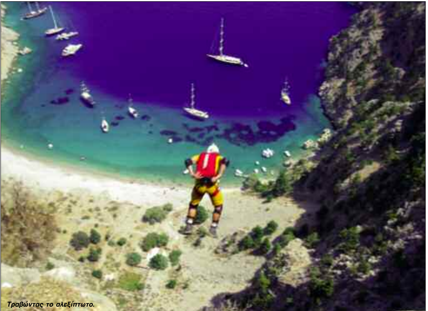
Τραβώντας το αλεξίπτωτο.

Τα πρώτα τέτοιου είδους άλματα τα ξεκίνησε από τη Βραζιλία και πρόσφατα μαζί με άλλους πέντε ξένους αθλητές έκανε άλματα σε διάφορες περιοχές της Νορβηγίας, της Ελβετίας, της Γερμανίας, της Ιταλίας και της Γαλλίας. Στην