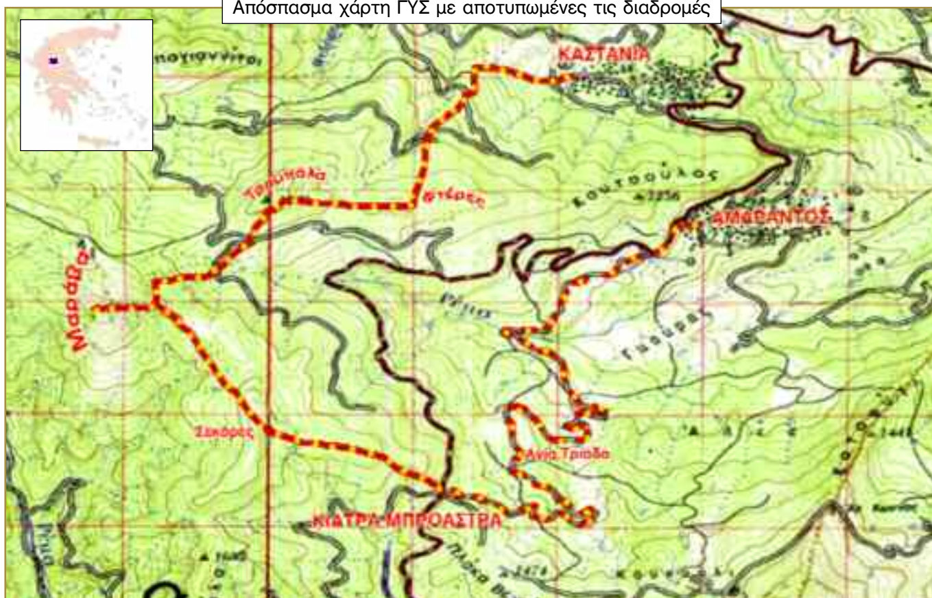
Απόσπασμα χάρτη ΓΥΣ με αποτυπωμένες τις διαδρομές