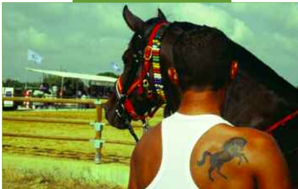
Εικόνες από την γιορτή των αλόγων.

Ο ναός στο κέντρο της αυλής της μονής είναι βασιλική, τρίκλιτος, ξυλόστεγος, χωρίς τρούλο. Παρατηρώντας το ναό διαπιστώνουμε ότι δεν εκτίστη ταυτόχρονα και από τους ίδιους τεχνίτες και με τον ίδιο ρυθμό. Ο ακαδημαϊκός κ. Αναστάσιος Ορλάνδος παρατηρεί, ότι το ανατολικό τμήμα κτίστηκε πρώτο. Γεγονός όμως απροσδόκητο διέκοψε τις εργασίες στο ναό. Επομένως το βυζαντινό τμήμα του κατασκευάστηκε στα τέλη του 12ου ή αρχές του 13ου αιώνα. Έπειτα οι Φράγκοι τροποποίησαν το αρχικό σχέδιο και αποπεράτωσαν το ναό με την προσθήκη του δεύτερου ορόφου του πρόναου και του εξωνάρθηκα. Δυστυχώς δεν υπάρχουν αρχαία έγγραφα, που αφορούν την ιστορία της μονής, γιατί είτε χάθηκαν στη θάλασσα λόγω τρικυμίας κοντά στη Ζάκυνθο που κατέφυγαν οι μοναχοί της μονής στα χρόνια της Επανάστασης αποφεύγοντας τον κίνδυνο των Τούρκων, είτε κήκαν όταν η μονή πυρπολήθηκε από τον Ιμπραήμ. Με αυτό το προσκύνημα στο «ιερό καταφύγιο» της Κυρά Βλαχέραινας πήρα το δρόμο της επιστροφής.