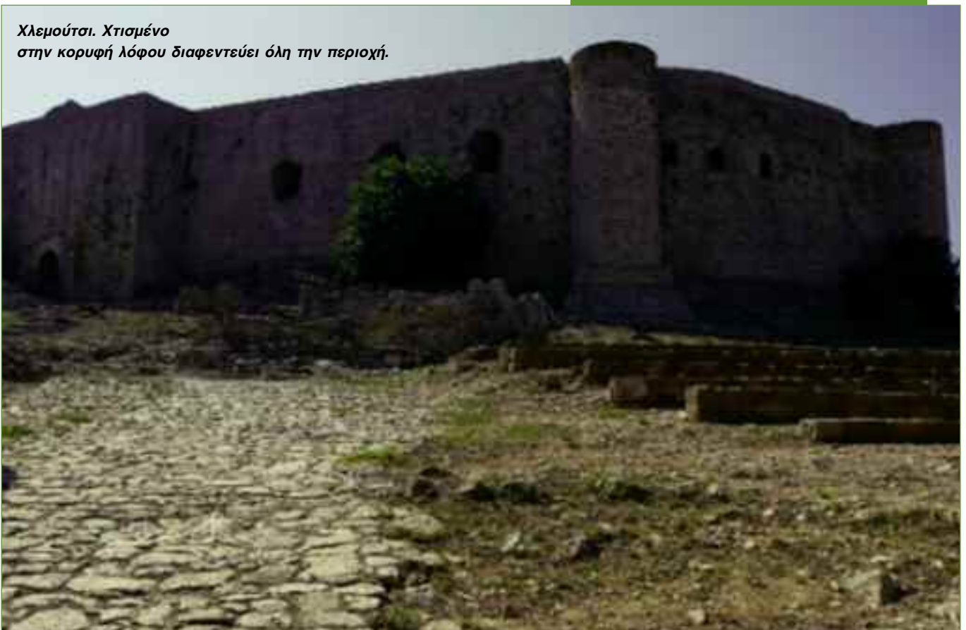
Χλεμούσι. Χτισμένο στην κορυφή λόφου διαφεντεύει όλη την περιοχή.