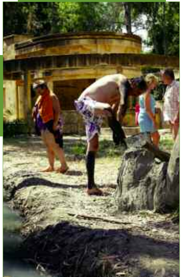
Λουτρά Κυλλήνης. Άνθρωποι αλείφονται με τη μαύρη λάσπη, που έχει θεραπευτικές ιδιότητες.

75η, η συμμετοχή του κόσμου ήταν τεράστια. Από νωρίς το πρωί το Ιππικό κέντρο της Ανδραβίδας είχε κατακλυσθεί από τους λάτρεις των αλόγων, που είχαν την ευκαιρία να θαυμάσουν επιδείξεις που πραγματοποιήσαν οι αναβάτες με τα άλογά τους, ελληνικών και ξένων φυλών. Ελλανόδικος Επιτροπή εξέτασε και βράβευσε τα καλύτερα από αυτά και τους ιδιοκτήτες τους. Φεύγοντας από την Ανδραβίδα ακολούθησα το δρόμο προς το λιμάνι της Κυλλήνης, την παλιά Γλαρέντζα. Πριν δεκαετίες το μικρό τοπικό τρένο που ξεκινούσε από τα Καβάσελα έφερνε τους ανθρώπους του κάμπου σε επαφή με το γαλάζιο της θάλασσας. Οι άνθρωποι που ολημερίς ζούσαν την αφόρητη ζέση της πεδιάδας γεύονταν τη δροσιά του Ιονίου στην παραλία της Κυλλήνης. Ο Βιλλεαρδουίνος