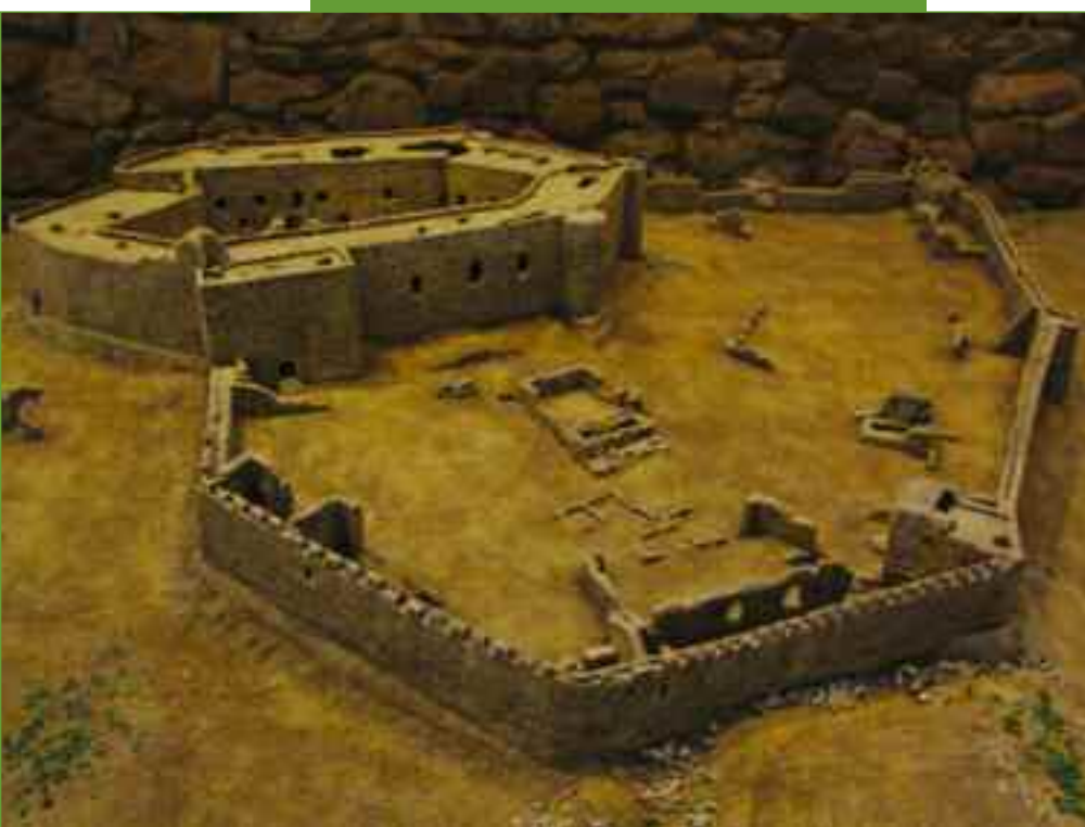
Μακέτα του κάστρου, που βρίσκεται στο μουσείο.

λεαρδουίνος πέτυχε να ανακηρυχθεί πρίγκιπας του Μορέως με έδρα την Ανδραβίδα, που εκείνη την εποχή ήταν η μεγαλύτερη πόλη της Πελοποννήσου. Εκτός των άλλων έργων κοσμίει την πόλη με τρεις ναούς, με μεγαλοπρεπέστερο αυτόν της Αγίας Σοφίας που χρησίμευε και ως τόπος συνελεύσεως των βαρόνων, ιπποτών, επισκόπων και άλλων υποτελών του πρίγκιπα της φραγκοκρατούμενης Πελοποννήσου. Η συνέλευση αυτή, ονομαζόμενη "κούρτη", έπαιρνε αποφάσεις για ζωτικά ζητήματα που απασχολούσαν τη χώρα.