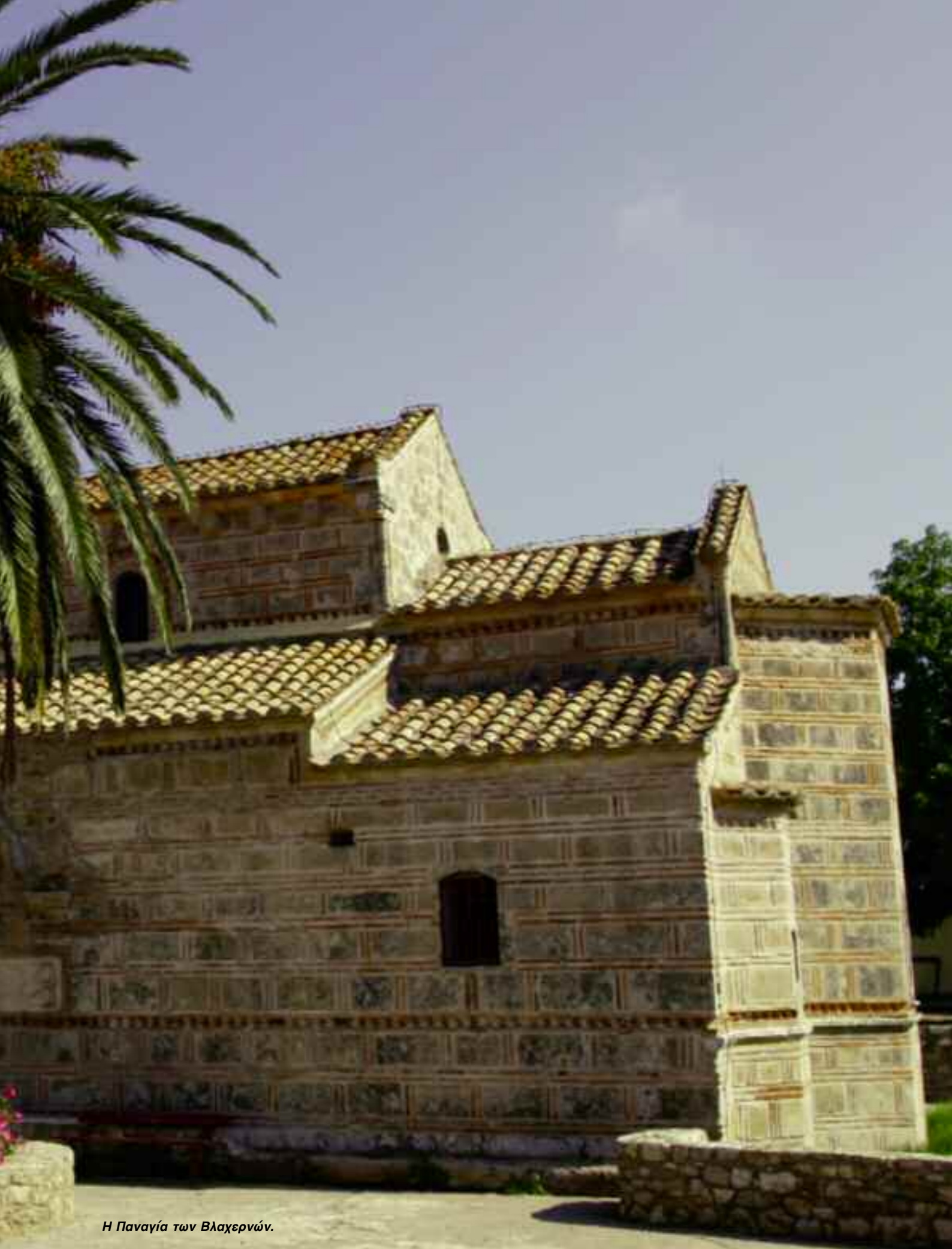
Η Παναγία των Βλαχερνών.