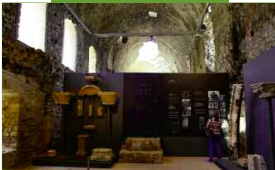
Με τη δημιουργία μουσείου μέσα στο κάστρο, ο επισκέπτης ζει την πολύχρονη ιστορία του.