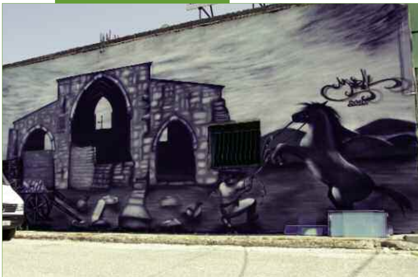
Ένα graffiti στην είσοδο της Ανδραβίδας δίνει όλη την ιστορία της πόλης.