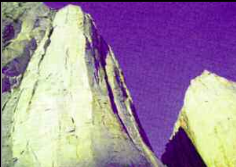
Επάνω. Το επιβλητικό βορειοανατολικό πιλιέ του Welshman's Peak.