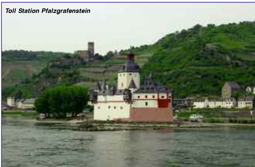
Toll Station Pfalzgrafenstein