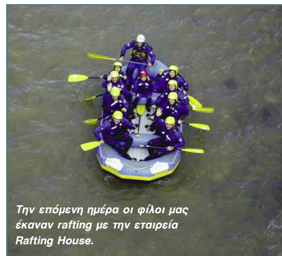
Την επόμενη ημέρα οι φίλοι μας έκαναν rafting με την εταιρεία Rafting House.

Μία σκάλα που καταλήγει σε μικρό αρνητικό στη δεξιά όχθη είναι το επόμενο «task» για την ομάδα, η οποία μας εξέπληξε όλους με τις γραμμές του νερού που ακολούθησε και πέρασε σε ασφαλή απόσταση από το μικρό αρνητικό.