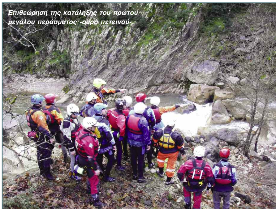
Επιθεώρηση της κατάληξης του πρώτου μεγάλου περάσματος -οιρό πετεινού-

Το επόμενο τμήμα τριάντα μέτρων του ποταμού, ήταν ίσως το πιο απαιτητικό (και λόγω κούρασης) και