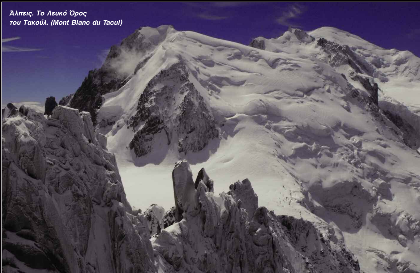
Άλπεις, Το Λευκό Όρος του Τακούλ. (Mont Blanc du Tacul)