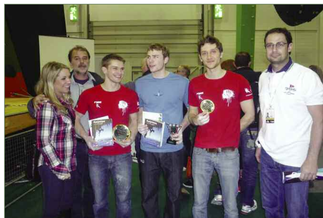
Οι νικητές των βρετανικών αγώνων bouldering με το έπαθλο ανα χείρας.

Η αναρρίχηση είχε δυναμική παρουσία στο ετήσιο Outdoors Show του Λονδίνου (13-16 Ιανουαρίου), αφού φιλοξενήθηκαν μεταξύ άλλων οι βρετανικοί αγώνες bouldering στις κατηγορίες Junior και Senior. Παράλληλα υπήρχαν τοίχοι αναρρίχησης για το κοινό με δωρεάν διδασκαλία. Η Κάλυμνος αντιπροσωπεύτηκε στο περίπτερο του ΕΟΤ σε μια ειδικά διαμορφωμένη 'γωνιά' από εκπροσώπους του Δήμου Καλυμνίου και της Ένωσης Ξενοδόχων, οι οποίοι ανέφεραν ότι το ενδιαφέρον του κόσμου για την Κάλυμνο ήταν μεγάλο, όχι μόνο για την αναρρίχηση αλλά και για