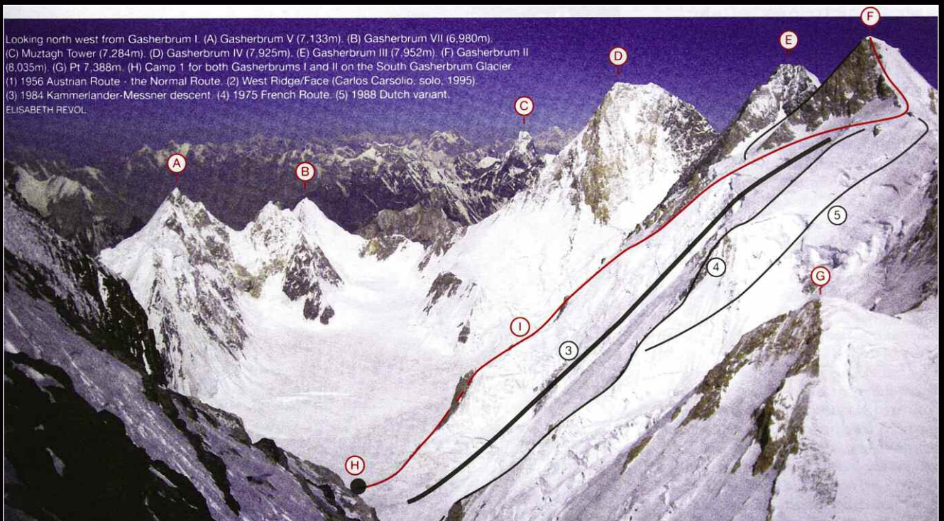
Looking north west from Gasherbrum I. (A) Gasherbrum V (7.133m). (B) Gasherbrum VII (6.980m). (C) Muztagh Tower (7.284m). (D) Gasherbrum IV (7.925m). (E) Gasherbrum III (7.952m). (F) Gasherbrum II (8.035m). (G) Pt 7.388m. (H) Camp 1 for both Gasherbrums I and II on the South Gasherbrum Glacier. (1) 1956 Austrian Route - the Normal Route. (2) West Ridge/Face (Carlos Carsolio, solo, 1995). (3) 1984 Kammerlander-Messner descent. (4) 1975 French Route. (5) 1988 Dutch variant.

Το Gasherbrum II όπως φαίνεται από το Gasherbrum I. Η νορμάλ διαδρομή (1) ακολουθεί τη μακριά Νοτιοδυτική Κόψη.