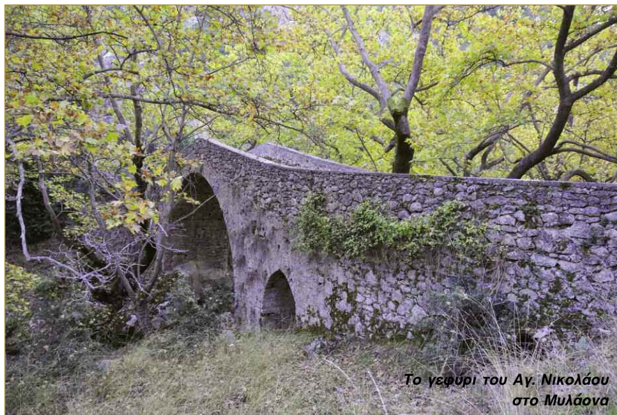
Το γεφύρι του Αγ. Νικολάου στο Μυλάνα