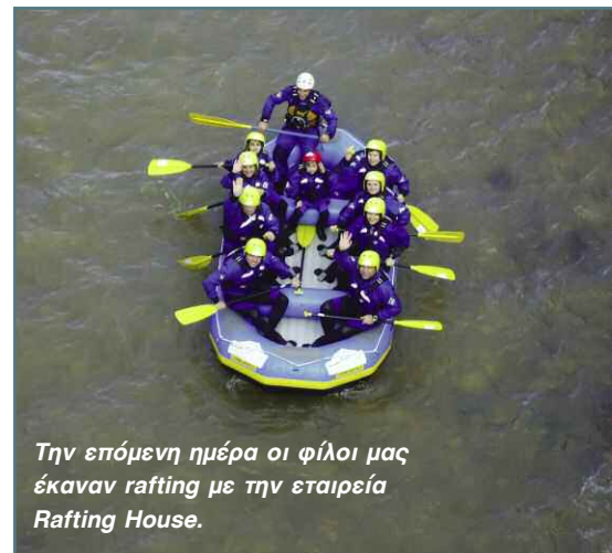
Την επόμενη ημέρα οι φίλοι μας έκαναν rafting με την εταιρεία Rafting House.

Μία σκάλα που καταλήγει σε μικρό αρνητικό στη δεξιά όχθη είναι το επόμενο «task» για την ομάδα, η οποία μας εξέπληξε όλους με τις γραμμές του νερού που ακολούθησε και πέρασε σε ασφαλή απόσταση από το μικρό αρνητικό.