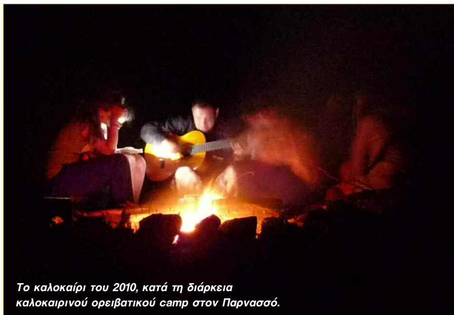
Το καλοκαίρι του 2010, κατά τη διάρκεια καλοκαιρινού ορειβατικού camp στον Παρνασσό.