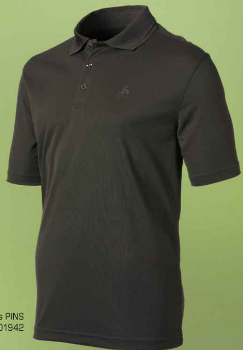
Polo shirt s/s PINS Art. 501942

Functional sportswear for a perfect body-feeling.