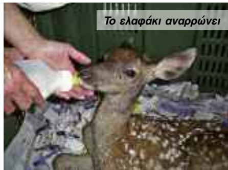
Το ελαφάκι αναρρώνει