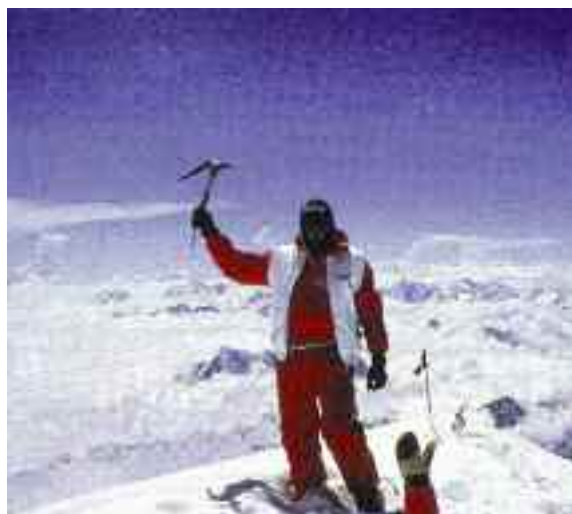
Δεξιά. Ο Erhard Loretan στην κορυφή του Everest. Αναρρίχηση και καταρρίχηση στη Στέγη του Κόσμου σε 43 ώρες - η επιτομή του αλπικού στυλ - μαζί με τον Jean Troillet.