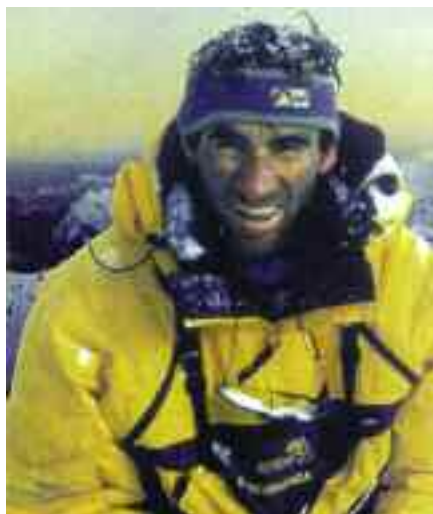
Αριστερά. Ο μεγάλος Ελβετός αλпинιστής Erhard Loretan.

την πρώτη χειμερινή στην Ανατολική του Dhaulagiri. Το 1986, σε 19 μέρες σκαρφάλωσε σε 38 κορυφές των Ελβετικών Άλπεων και το καλοκαίρι ...σκάρε την ορειβατική κοινότητα, με μια ιστορική ανάβαση. Αναρρίχηση και καταρρίχηση σε 43 ώρες, στην 2500 μέτρων Βόρεια ορθοπλαγιά του Everest, από το Hornbein Couloir. Όπως είπε και ο Kurtyka, δεν πήραν και δεν άφησαν τίποτα, σε μια ανάβαση από άλλο πλανήτη. Άλλες επιτυχίες ακολούθησαν, όπως η πρώτη στη Νοτιοδυτική ορθοπλαγιά του Cho Oyu και η ταχύτερη αναρρίχηση στη Νότια της Shishapangma. Μια συνέντευξη που δημοσιεύτηκε στο Mountain Magazine, ανέφερε ότι ο Erhard δεν κάπνιζε αλλά ενίοτε έπινε, δεν έπαιρνε βοήθημα, παρά μόνο ήπια υπνωτικά χάπια και οι προτιμήσεις του για τις ίδιες τις αναβάσεις, συνοψίζονταν στα ακόλουθα λόγια. Όσο πιο δύσκολα, ψηλά και γρήγορα είναι δυνατόν και φυσικά σε αλπικό στυλ. Στις τελευταίες του μέρες στα βουνά, συνήθιζε να λέει: "Όταν αγαπάς αυτό που κάνεις, όπως συμβαίνει με μένα και το σκαρφάλωμα, μπορείς να κάνεις τα πάντα, δεν μοιάζει σε να θυσιάζεις τίποτα και δεν πιστεύεις ότι κάνεις απίστευτα πράγματα, απλά φαίνονται φυσιολογικά".