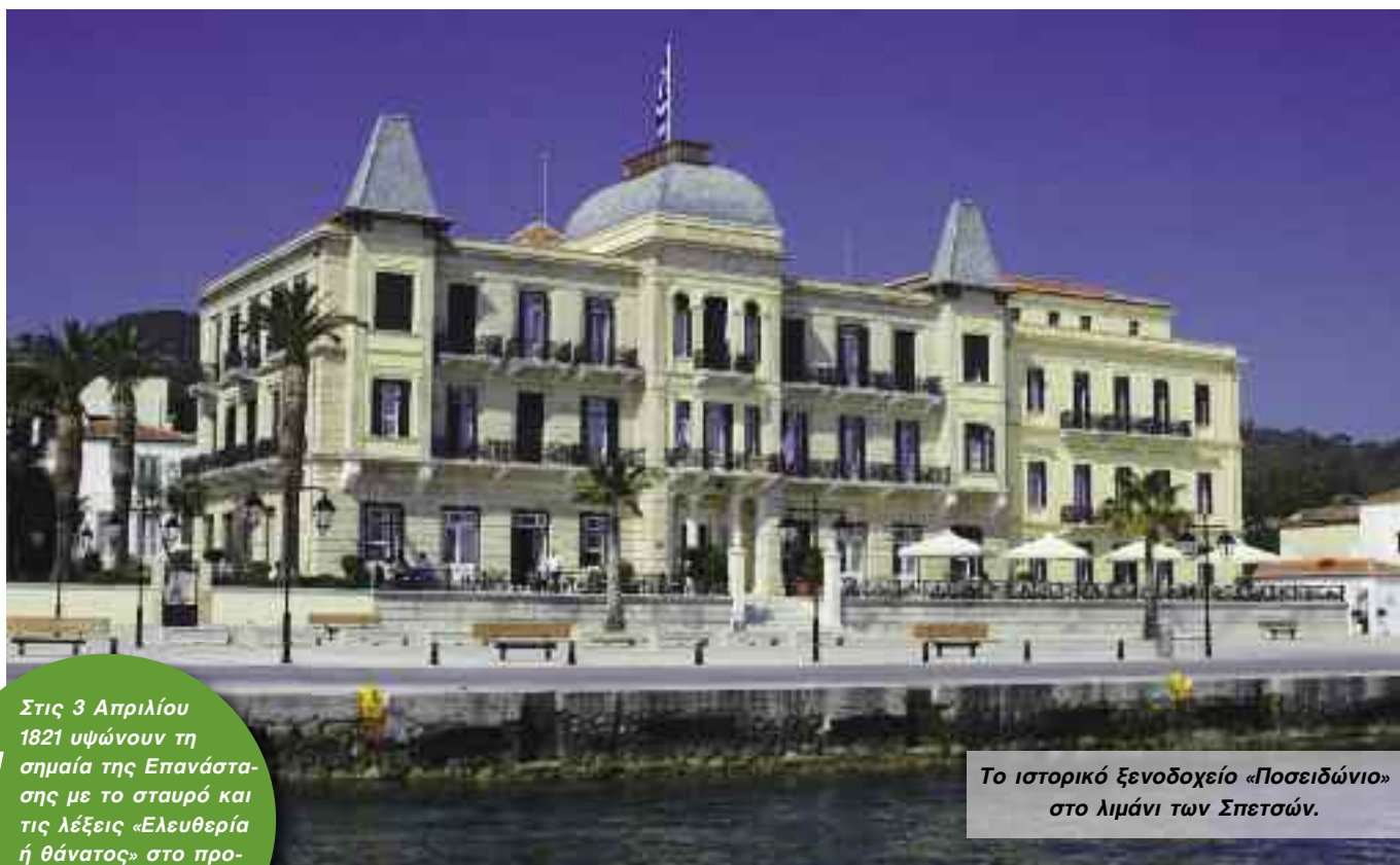
Το ιστορικό ξενοδοχείο «Ποσειδώνιο» στο λιμάνι των Σπετσών.

! Στις 3 Απριλίου 1821 υψώνουν τη σημαία της Επανάστασης με το σταυρό και τις λέξεις «Ελευθερία ή θάνατος» στο προαύλιο του μητροπολιτικού ναού του Αγίου Νικολάου.