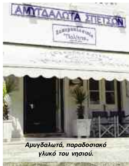
Αμυγδαλωτά, παραδοσιακό γλυκό του νησιού.

τον αποκλεισμό του Ναυπλίου και να επισιτίσουν στη συνέχεια τους πολιορκούμενους. Οι Σπετσιώτες, μόνο λίγοι παρέμειναν στο νησί, ήταν έτοιμοι από μέρες με επικεφαλής το γηραίο πρωτάρχοντα Χατζηγιάννη Μέξη. Τα σπετσιώτικα και υδραϊκά πλοία βάλλουν πρώτα εναντίον του εχθρικού στόλου. Ακολουθούν βολές από τις ακτές των Σπετσών και της Κόστα, όπου κι εκεί υπήρχε κανονιστάσιο. Και ενώ η ναυμαχία κρατά πέντε ώρες, γίνεται νέα απόπειρα εμπρησμού μεγάλου τουρκικού πλοίου από ελληνικό πυρπολικό. Από το κανονιστάσιο των Σπετσών, όρθιος στο πυρπολικό του εξορμά ο τολμηρός και ριψοκίνδυνος Σπετσιώτης πυρπολητής Κοσμάς Μπαρμπάτσης και κατευθύνεται κατά της τουρκικής στολαρχίδας. Η κίνηση αυτή του πυρπολητή γίνεται αντιληπτή από τους εχθρούς και έντρομος ο καπετάν Μεχμέτ Πασάς δίνει το σύνθημα της υποχώρησης του στόλου και έτσι σώζεται το νησί.