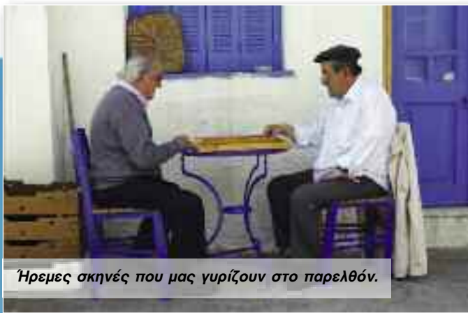
Ήμερες σκηνές που μας γυρίζουν στο παρελθόν.