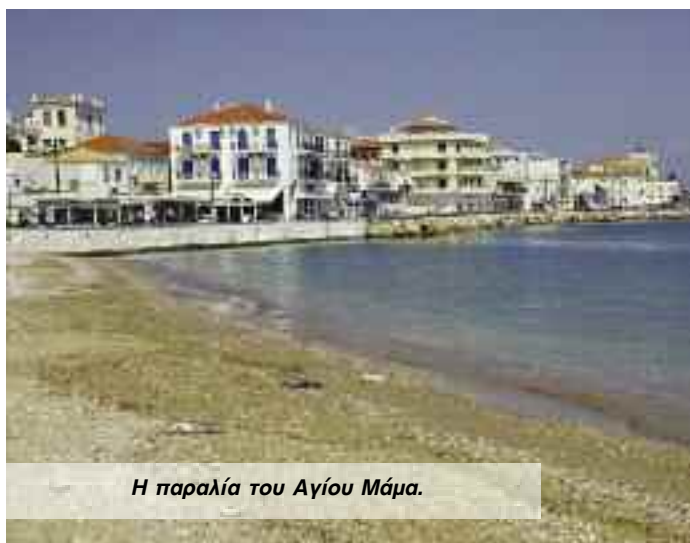
Η παραλία του Αγίου Μάμα.