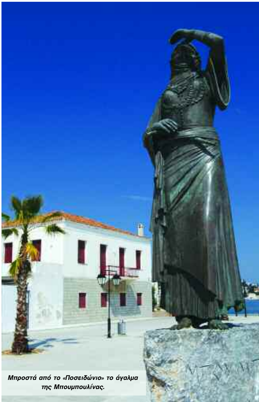
Μπροστά από το «Ποσειδώνιο» το άγαλμα της Μπουμπουλίνας.

τον αποκλεισμό του Ναυπλίου και να επισιτίσουν στη συνέχεια τους πολιορκούμενους. Οι Σπετσιώτες, μόνο λίγοι παρέμειναν στο νησί, ήταν έτοιμοι από μέρες με επικεφαλής το γηραίο πρωτάρχοντα Χατζηγιάννη Μέξη. Τα σπετσιώτικα και υδραϊκά πλοία βάλλουν πρώτα εναντίον του εχθρικού στόλου. Ακολουθούν βολές από τις ακτές των Σπετσών και της Κόστα, όπου κι εκεί υπήρχε κανονιστάσιο. Και ενώ η ναυμαχία κρατά πέντε ώρες, γίνεται νέα απόπειρα εμπρησμού μεγάλου τουρκικού πλοίου από ελληνικό πυρπολικό. Από το κανονιστάσιο των Σπετσών, όρθιος στο πυρπολικό του εξορμά ο τολμηρός και ριψοκίνδυνος Σπετσιώτης πυρπολητής Κοσμάς Μπαρμπάτσης και κατευθύνεται κατά της τουρκικής στολαρχίδας. Η κίνηση αυτή του πυρπολητή γίνεται αντιληπτή από τους εχθρούς και έντρομος ο καπετάν Μεχμέτ Πασάς δίνει το σύνθημα της υποχώρησης του στόλου και έτσι σώζεται το νησί.