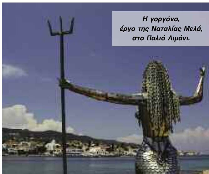
Η γοργόνα, έργο της Ναταλίας Μελά, στο Παλιό Λιμάνι.