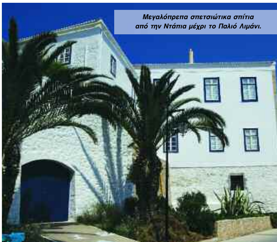
Μεγαλόπρεπα σπετσιώτικα σπίτια από την Ντάπια μέχρι το Παλιό Λιμάνι.