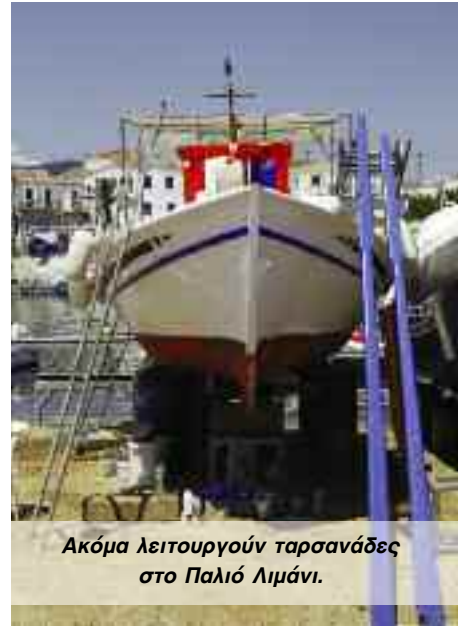
Ακόμα λειτουργούν τارسανάδες στο Παλιό Λιμάνι.