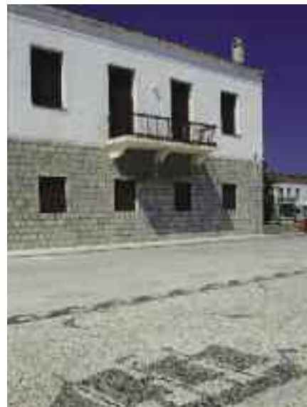
Σε πολλούς δρόμους τα βοτσαλωτά είναι πραγματικά έργα τέχνης.

ταξινομήθηκαν από το Σπετσιώτη ακαδημαϊκό και καθηγητή στο Πανεπιστήμιο Αθηνών Γεώργιο Σωτηρίου σε επτά αίθουσες του αρχοντικού. Το μουσείο έχει επλουτιστεί και με τα ευρήματα της υποθαλάσσιας έρευνας του Ινστιτούτου Εναλίων Αρχαιολογικών Ερευνών, στο Δοκό και τα Ίρια. Τα ευρήματα του ναυαγίου μάς δίνουν μια καλύτερη εικόνα για τους Πρωτοελλαδικούς οικισμούς της νότιας ακτής της Αργολίδας και των γειτονικών νησιών, καθώς και για τις θαλάσσιες οδούς επικοινωνίας και εμπορίου στο Μυρτώο πέλαγος και το Σαρωνικό κόλπο. Ας αφήσουμε όμως την ξενάγηση στα ιστορικά αρχοντικά του νησιού και ας κάνουμε μια βόλτα μέχρι το Φάρο, πάνω από το Παλιό Λιμάνι. Από την Ντάπια μέχρι το Παλιό Λιμάνι ο θαλασσινός αέρας σε αναζωογονεί και το μάτι απολαμβάνει τα πανέμορφα σπετσιώτικα σπίτια. Τα περισσότερα διώροφα περιβάλλονται από αυλή, στρωμένη με θαλασσινά βότσαλα που σχηματίζουν διάφορα σχήματα, ενώ προστατεύονται από ψηλούς πέτρινους τοίχους.