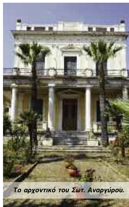
Το αρχοντικό του Σωτ. Αναργύρου.