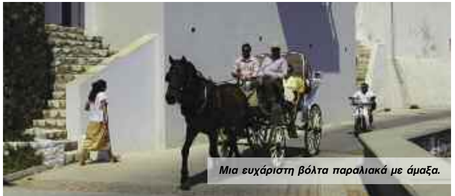
Μια ευχάριστη βόλτα παραλιακά με άμαξα.