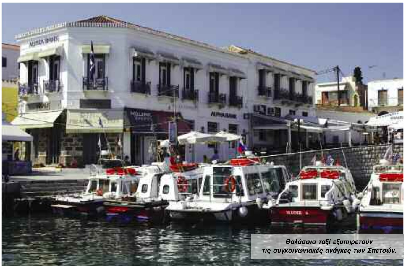
Θαλάσσια ταξί εξυπηρετούν τις συγκοινωνιακές ανάγκες των Σπετσών.