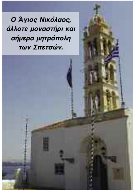
Ο Άγιος Νικόλαος, άλλοτε μοναστήρι και σήμερα μητρόπολη των Σπετσών.

Επειδή βρισκόμαστε στο καλοκαίρι πρέπει να αναφέρουμε και τις γνωστές παραλίες του νησιού. Κουνουπίτσα, Σχολές, Ζογεριά, Αγ. Παρασκευή, Αγ. Ανάργυροι, Ζυλοκέρizza, Αγία Μαρίνα.