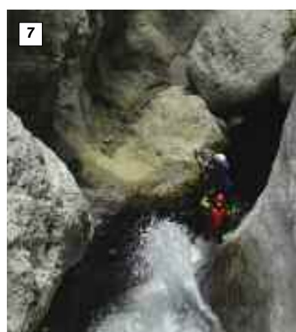
1-7. Εικόνες από το κεντρικό τμήμα του φαραγγιού! Ένα πραγματικά όμορφο φαράγγι!