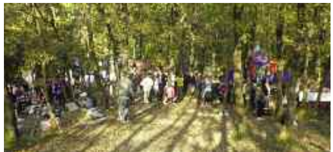
Από τους αγώνες orienteering στην Κωνσταντινούπολη το Νοέμβριο του 2010.

Πληροφορίες για την Ελλάδα στο: www.orienteering.org.gr και στο www.orienteering.org/SciJO/SciJhome.htm