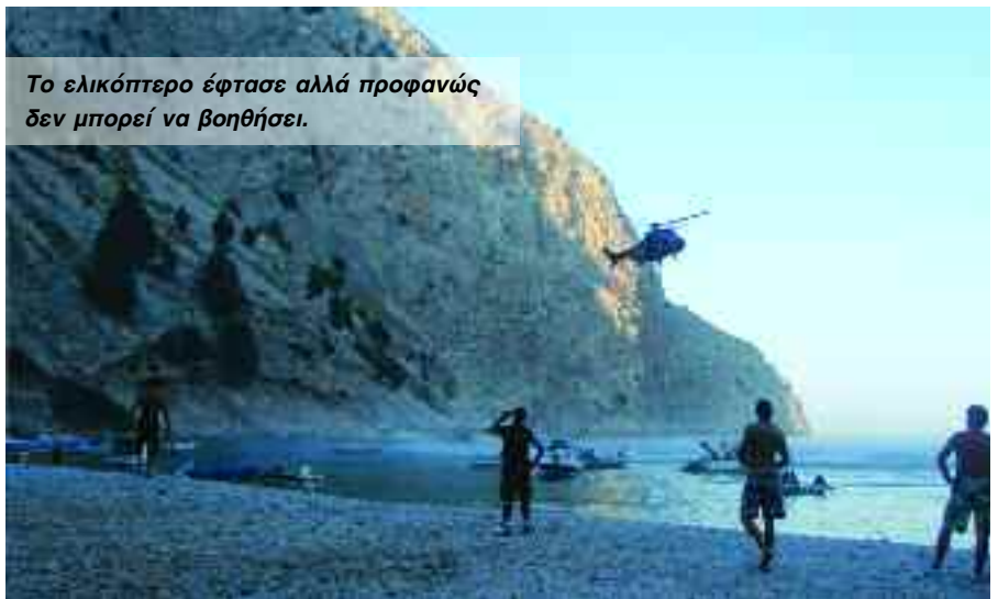
Το ελικόπτερο έφτασε αλλά προφανώς δεν μπορεί να βοηθήσει.