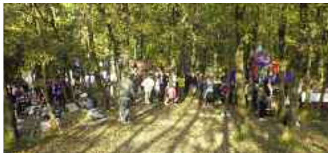
Από τους αγώνες orienteering στην Κωνσταντινούπολη το Νοέμβριο του 2010.

Πληροφορίες για την Ελλάδα στο: www.orienteering.org.gr και στο www.orienteering.org/SciJO/SciJhome.htm