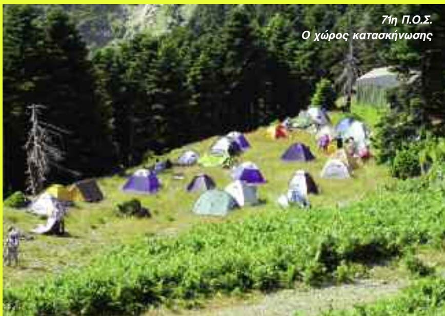
71η Π.Ο.Σ. Ο χώρος κατασκήνωσης