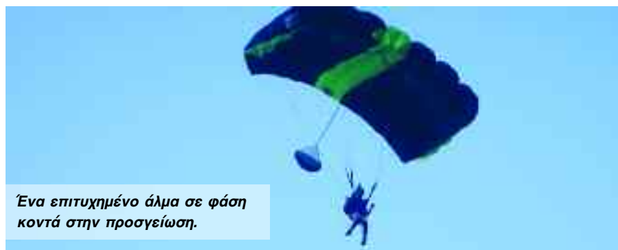
Ένα επιτυχημένο άλμα σε φάση κοντά στην προσγείωση.