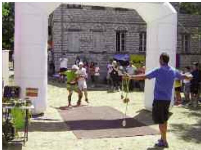
Το κείμενο και οι φωτογραφίες είναι από την Οργανωτική Επιτροπή του 1ου Ορεινού Μαραθωνίου Ζαγορίου