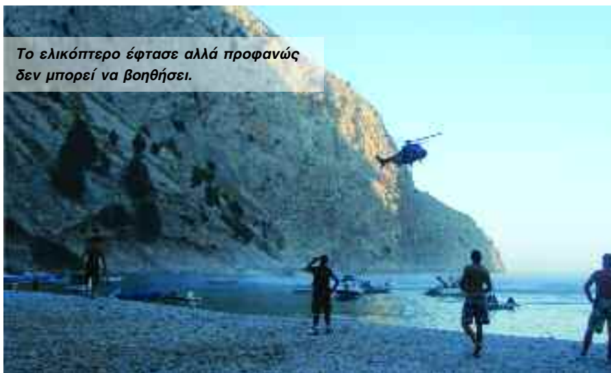
Το ελικόπτερο έφτασε αλλά προφανώς δεν μπορεί να βοηθήσει.