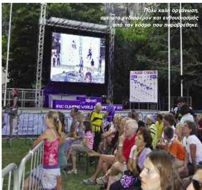
Πολύ καλή οργάνωση, αμείωτο ενδιαφέρον και ενθουσιασμός από τον κόσμο που παραβρέθηκε.