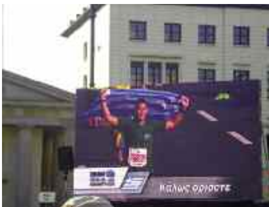
Στον τερματισμό στην πύλη του Βατεμβούργου.

Επιθυμούσαμε, έτσι με τον συμβολικό αυτό τρόπο, να στηρίξουμε στο ελάχιστο, ως αθλητές, με τις μικρές δυνάμεις μας, την τιτάνια προσπάθεια που κάνει η χώρα μας, να σπάσει τον κλοιό της απομόνωσης, να βγει και πάλι στο προσκήνιο των εξελίξεων. Μέσα σε αυτή την άθυρη εποχή, μέσα σε αυτή την απουσία αντίστασης και εναλλακτικής δράσης οι ορειβάτες-αθλητές του Αθηναϊκού Ορειβατικού, λένε ΝΑΙ στις προκλήσεις των καιρών. Ειρηνικά, αγωνιστικά, με την αθλητική γλώσσα και ήθος που γνωρίζουν επαρκώς. Αναντίρρητα ζούμε την εποχή της δράσης και αυτονόητο είναι, ότι η ζωή δεν γνωρίζει αδιέξοδα. Δεν είναι όμως η οργή που οδήγησε τα βήματά μας, στο δρόμο του Μαραθωνίου, αλλά η ελπίδα. Η ελπίδα που από τον βέβαιο θάνατο της στασιμότητας, υπάρχει και η μικρή, έστω ελάχιστη προοπτική διαφυγής.