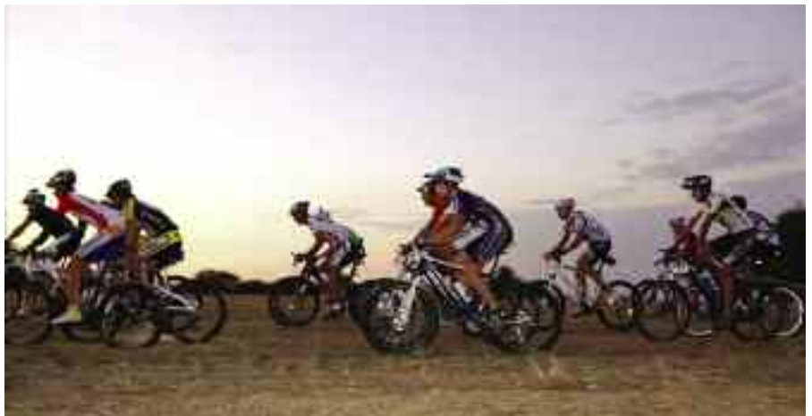
Οι φωτογραφίες είναι από το site www.sfindami.gr