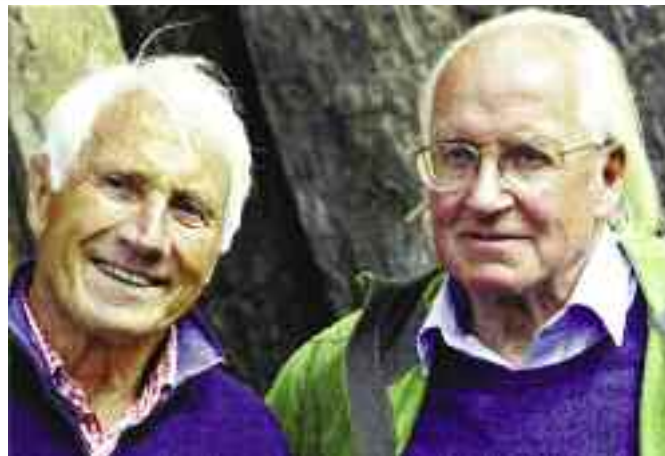
Ο μεγάλος Walter Bonatti (αριστερά) με τον Doug Scott. Ο τελευταίος είπε για αυτόν: "Μάλλον ο μεγαλύτερος αλπινιστής που είδαμε ποτέ".

το πέτυχε και έπειτα, ξεκίνησε μια καριέρα σαν συγγραφέας και ρεπόρτερ. Η βαριά του κληρονομιά στον Αλπινισμό, είναι ένα παράδειγμα για το πώς πρέπει να προσεγγίζουμε τις διαδρομές, σε όλες τις συνθήκες και με το καλύτερο δυνατό στυλ. Το 2009, ο Bonatti έγινε ο πρώτος ορειβάτης που τιμήθηκε με το Piolet d'Or, για την προσφορά του στον Αλπινισμό και τη διαχρονικότητα της παρακαταθήκης του, στους νέους. Ας θυμηθούμε μερικά από τα λόγια του. "Κάθε αναρρίχηση που έκανα, είχε να κάνει με το να βρίσκω προκλήσεις για τον εαυτό μου. Ένωθα ένα απεριόριστο αίσθημα θριάμβου, όχι όταν στεκόμουν στην κορυφή, αλλά όταν πάλευα ακόμη πάνω στην ορθοπλαγιά και ένιωθα ότι τίποτα δεν είναι ικανό να με σταματήσει".