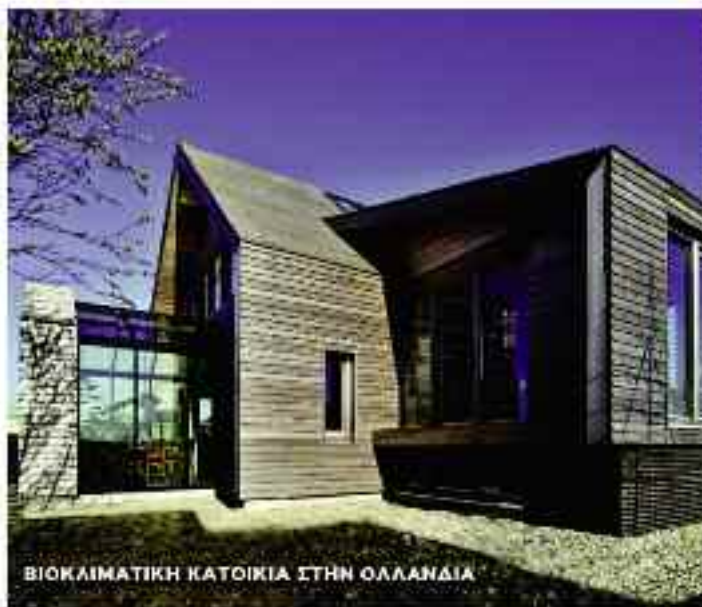
ΒΙΟΚΛΙΜΑΤΙΚΗ ΚΑΤΟΙΚΙΑ ΣΤΗΝ ΟΛΛΑΝΔΙΑ

ΕΤΕΡΟΣ ΔΙΕΥΘΥΝΤΗΣ: ΠΑΝΟΣ ΚΑΡΑΓΙΩΡΓΙΩΤΗΣ ECOΔΟΜΕΙΝ ΠΕΡΙΟΔΙΚΗ ΕΚΔΟΣΗ ΓΙΑ ΤΗΝ ΒΙΟΚΛΙΜΑΤΙΚΗ ΑΡΧΙΤΕΚΤΟΝΙΚΗ & ΤΗΝ ΠΕΡΙΒΑΛΛΟΝΤΙΚΗ ΚΟΙΝΩΝΙΑ