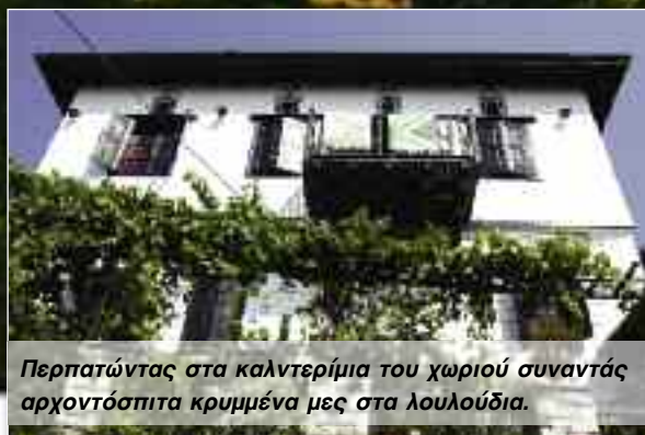
Περπατώντας στα καλντερίμια του χωριού συναντάς αρχοντόσπιτα κρυμμένα μες στα λουλούδια.