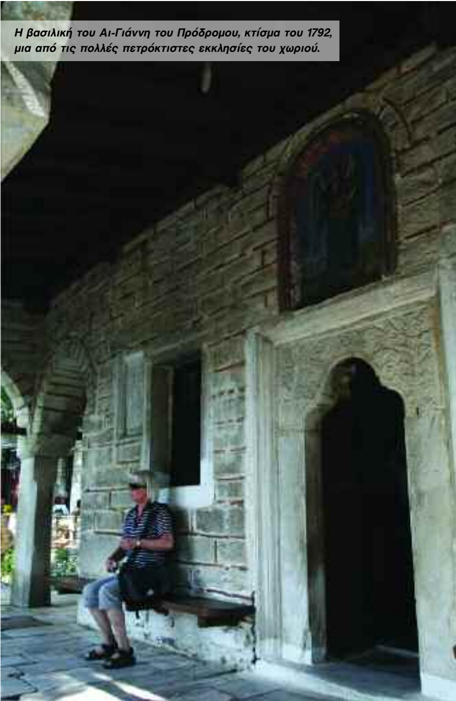
Η βασιλική του Αι-Γιάννη του Πρόδρομου, κτίσμα του 1792, μια από τις πολλές πετρόκτιστες εκκλησίες του χωριού.