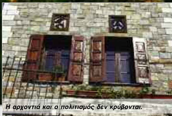
Η αρχοντιά και ο πολιτισμός δεν κρύβονται.