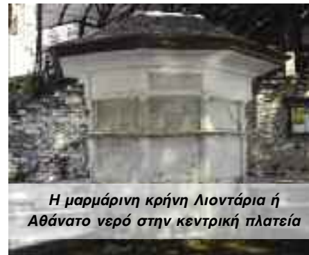
Η μαρμάρινη κρήνη Λιοντάρια ή Αθάνατο νερό στην κεντρική πλατεία

Ανηφορικό καλντερίμι οδηγεί στην τρίκλιτη βασιλική της Κοιμήσεως της Θεοτόκου, χρονολογημένη στα 1767 και ανακαινισμένη στα 1963 μετά την καταστροφή της από τους σεισμούς του 1955. Είναι χτισμένη κοντά στο μέρος που βρισκόταν η κατεστραμμένη από κατολίθωση παλιά μονή της Οξείας Επισκέψεως. Στο εσωτερικό της εκκλησίας θα δείτε μαρμάρινη εικόνα, μάλλον από την παλιά μονή, που παριστάνει την Παναγία, έχοντας στο στήθος της σε κύκλο το μικρό Χριστό να ευλογεί.