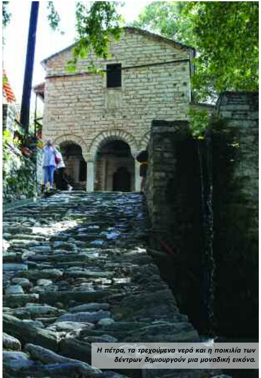
Η πέτρα, τα τρεχούμενα νερά και η ποικιλία των δέντρων δημιουργούν μια μοναδική εικόνα.

Η Μακρινίτσα προσφέρεται όλες τις εποχές του χρόνου για επίσκεψη. Τα αναπαλαιωμένα αρχοντικά της με τους φιλόξενους κατοίκους της εγγυώνται μια αξέχαστη διαμονή μέσα στην πλούσια πηλιορείτικη χλωρίδα.