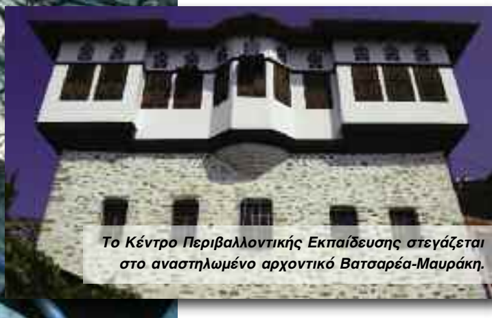
Το Κέντρο Περιβαλλοντικής Εκπαίδευσης στεγάζεται στο αναστηλωμένο αρχοντικό Βατσαρέα-Μαυράκη.