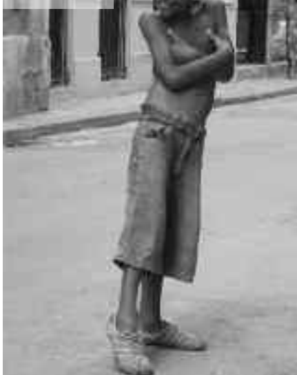
el chico Habanero