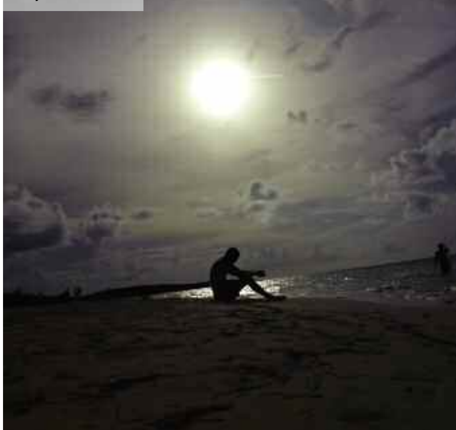
Cayo San Guillermo