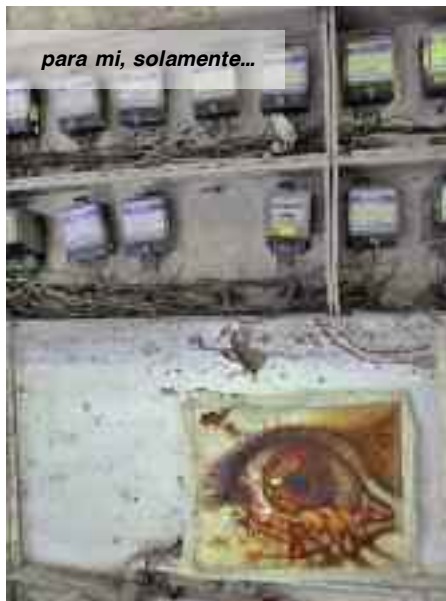
para mi, solamente...