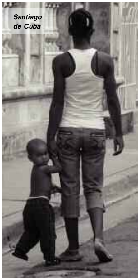
Santiago de Cuba

Μοναδική εμπειρία το ταξίδι με το αμάξι στην ενδοχώρα και στην επαρχία. Απέραντο φυσικό τοπίο, ερημικοί δρόμοι και όλος ο λαός των Κουβανών να κάνει auto-stop χαμογελώντας, τραγουδώντας, χορεύοντας... αγωνιώντας για το αν θα σταματήσω να τους μεταφέρω, αν όχι στον προορισμό τους, τότε απλά λίγο πιο κάτω.