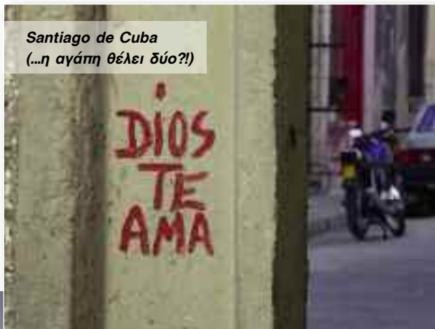
Santiago de Cuba (...η αγάπη θέλει δύο?!)

Η πόλη κινείται σε ρυθμούς αργούς λόγω της ζέστης, αλλά με την πρώτη ευκαιρία οι Κουβανοί φροντίζουν σε ένα κομμάτι χαρτί να γράψουν μουσική και ρυθμό, χωρίς νότες και παρτιτούρες, παρά μόνο με κωδικοποιημένους ρυθμικούς χαρακτήρες και «cosas locas 11 ». Η συνέχεια έχει πολύ χορό, φωναχτά χαμόγελα και ανάσες που μυρίζουν ρούμι.