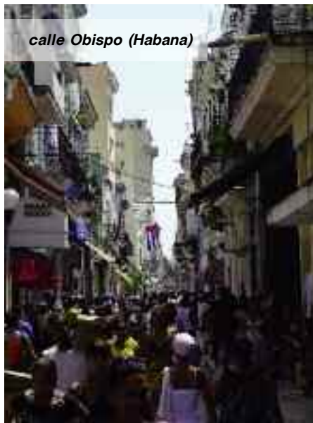
calle Obispo (Habana)