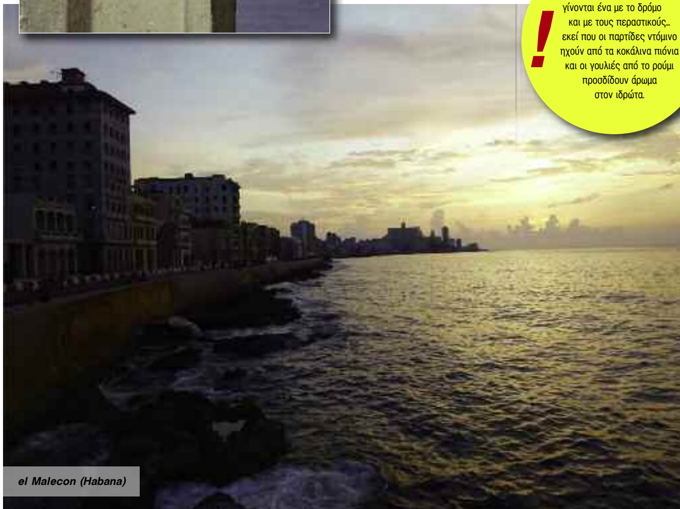
el Malecon (Habana)

Ο υπόλοιπος κόσμος είναι έξω... εκεί που τα σπίτια τους γίνονται ένα με το δρόμο και με τους περαστικούς... εκεί που οι παρτίδες ντόμινο ηχούν από τα κοκάλινα πιόνια και οι γουλιές από το ρούμι προσδίδουν άρωμα στον ιδρώτα.