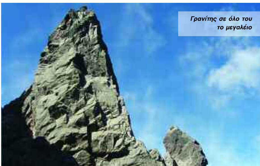
Γρανιτής σε όλο του το μεγαλείο