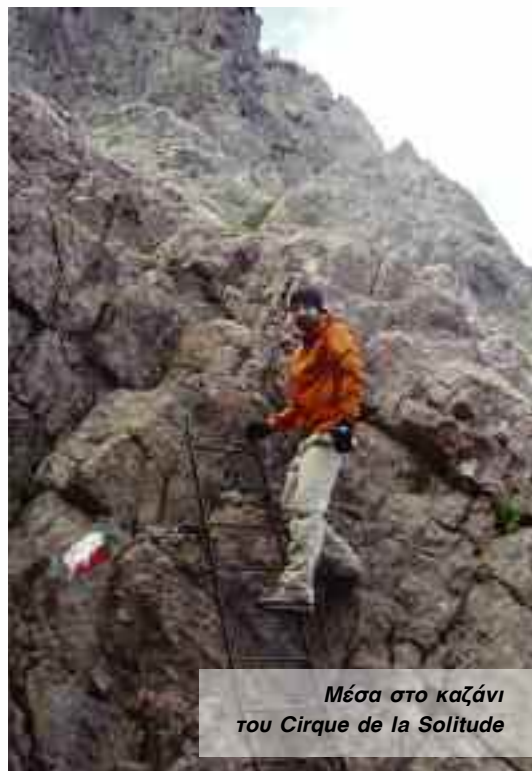
Μέσα στο καζάνι του Cirque de la Solitude

Ξεκινάω από το διάσελο της Bavella επάνω στο κύριο μονοπάτι του GR20 για περίπου μισό χιλιόμετρο μέχρι το άσπρο άγαλμα της Παναγίας