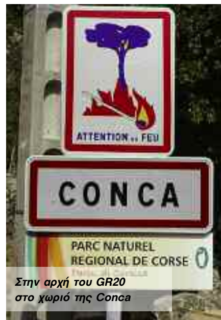
Στην αρχή του GR20 στο χωριό της Conca