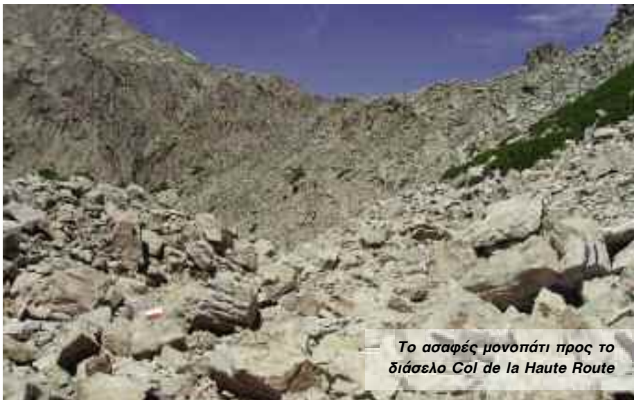
Το ασαφές μονοπάτι προς το διάσελο Col de la Haute Route

Ο προορισμός σήμερα είναι οι στάνες της Vaccaja σε υψόμετρο 1620μ. Μια καταπληκτική ημέρα περνώντας μέσα από αλπικές γαλαζοπράσινες λίμνες, γρανιτένιες πλαγιές και μια καταπράσινη πεδιάδα και όλα αυτά μέσα στον πυρήνα του ορεινού όγκου της Κορσικής. Από την Grotelle ένα καλοσηματισμένο μονοπάτι με μερικές σιδερένιες σκάλες και αλυσίδες οδηγεί στη λίμνη Lac de Mellu, μια λίμνη σε σχήμα μήλου με γρασίδι γύρω από τις όχθες της. Λίγο ψηλότερα συναντάω τη λίμνη Capitellu σε υψόμετρο 1930μ με κατακάρυφες γρανιτένιες πλαγιές να βυθίζονται μέσα στα κρυστάλλινα νερά της. Η λίμνη Capitellu έχει βάθος 40μ και είναι η βαθύτερη λίμνη στο νησί της Κορσικής. Ακολουθώ ένα ακαθόριστο μονοπάτι μέχρι την κορυφογραμμή και τραβερσάρω ένα βράχινο τμήμα πάνω από τη λίμνη Capitellu μέχρι το ψηλότερο σημείο του GR20, Breche de Capitellu σε υψόμετρο 2225μ. Η θέα προς τις λίμνες πολύ όμορφη, με τις επιβλητικές κορυφές του Monte Rotondo και του Maniccia τριγύρω μου. Μια απότομη κατάβαση οδηγεί στο καταφύγιο Manganu και την πεδιάδα Campotile. Διασχίζω την πεδιάδα μέχρι τις στάνες της Vaccaja, ένα καταπληκτικό μέρος, μια φάρμα που παράγει το φημισμένο κατακίσιο τυρί της Κορσικής.