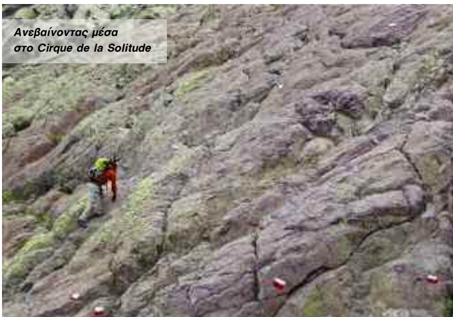
Ανεβαίνοντας μέσα στο Cirque de la Solitude

Τη σημερινή μέρα το μονοπάτι περνάει μέσα από πυκνό ελατοδάσος με κάποιες μικρές ανηφόρες και μια μεγάλη κατάβαση στο μικρό χωριό της Vizzavona. Ουσιαστικά τραβερσάρω τις πλαγιές του βουνού Monte Renoso, που δεσπόζει σε αυτό το σημείο της Κορσικής. Μια μικρή ανηφόρα οδηγεί στις μικρές στάνες του Traghjetta. Ο καιρός και σήμερα πολύ ασαθής και βροχερός. Στη στάνη κάνω μια στάση για 4 περίπου ώρες για να κοπάζει η καταιγίδα και ο βοσκός μου προσφέρει ψωμί, λουκάνικα και τσάι. Μετά την καταιγίδα τον ευχαριστώ και του αφήνω για δώρο μια μικρή ελληνική σημαία που είχα μαζί μου και ανηφορίζω προς την κορυφογραμμή μέχρι το μικρό χιονοδρομικό σταθμό του Capanelle με το ομώνυμο καταφύγιο. Συνεχίζω μέσα στο δάσος μέχρι το πέρασμα Bocca Palmente, ένα πέρασμα που έχει τρομερή θέα προς το βορινό κομμάτι του GR20. Μετά το πέρασμα το μονοπάτι κατηφορίζει για πολλές ώρες μέσα από ένα δάσος με κόκκινες οξείες, με συνεχόμενες φουρκέτες μέχρι την Vizzavona, τη μέση ακριβώς του GR20.