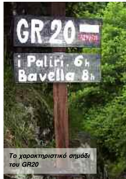
Το χαρακτηριστικό σημάδι του GR20