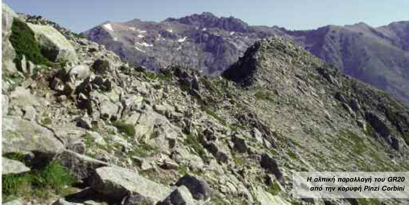
Η αλπική παραλλαγή του GR20 από την κορυφή Pinzi Corbini