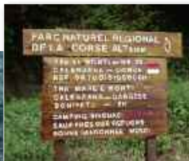
Αριστερά. Το τέλος του GR20 στην Calenzana