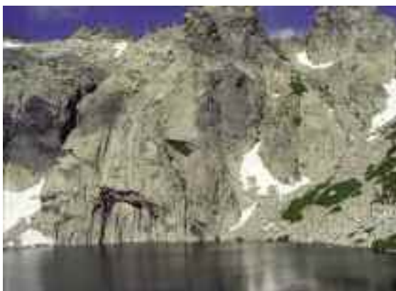
Αριστερά και δεξιά. Η αλπική λίμνη Capitelu