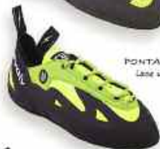
PONTAS Lace up