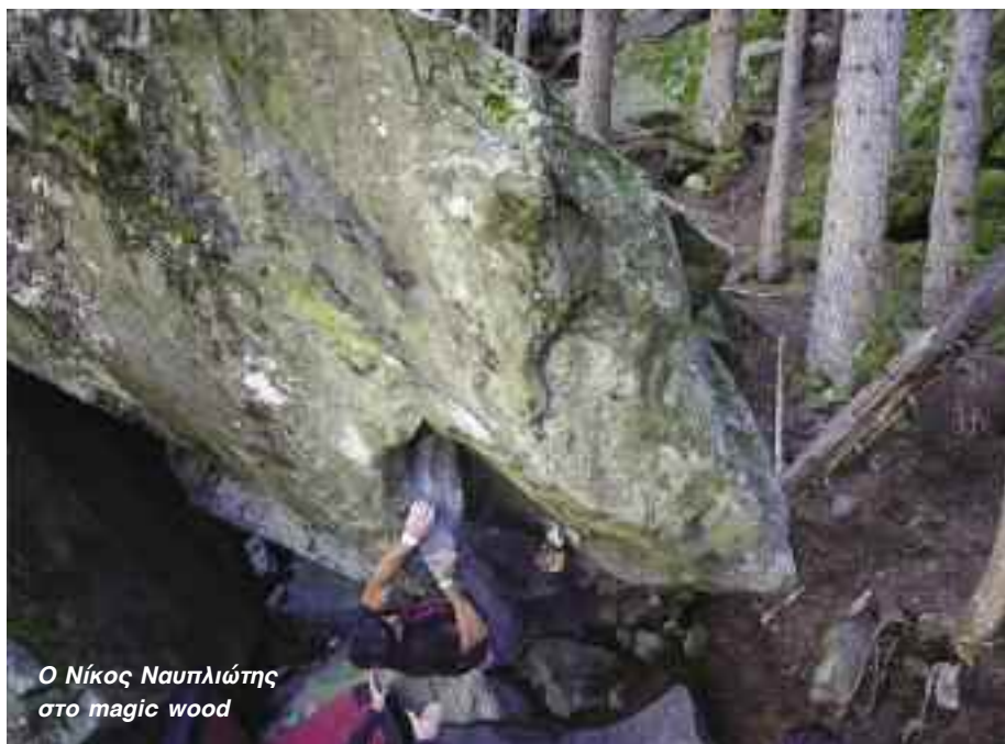
Ο Νίκος Ναυπλιώτης στο magic wood