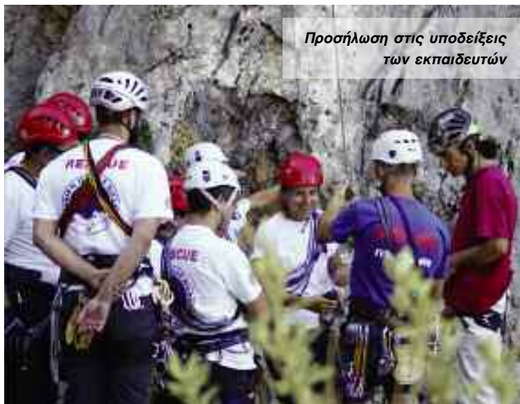
Προσήλωση στις υποδείξεις των εκπαιδευτών

Συνωστισμός πάνω στο βράχο, κατά τις ασκήσεις ανάβασης σε σχοινί, σε ορθοπλαγιά στο πεδίο Αλώνι της Λαγκάδας Ταϊγέτου