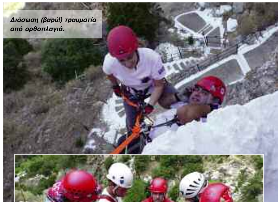
Διάσωση (βαρύ!) τραυματία από ορθοπλαγιά.