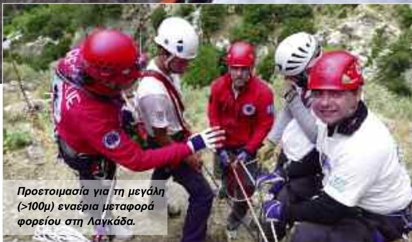
Προετοιμασία για τη μεγάλη (>100μ) εναέρια μεταφορά φορείου στη Λαγκάδα.