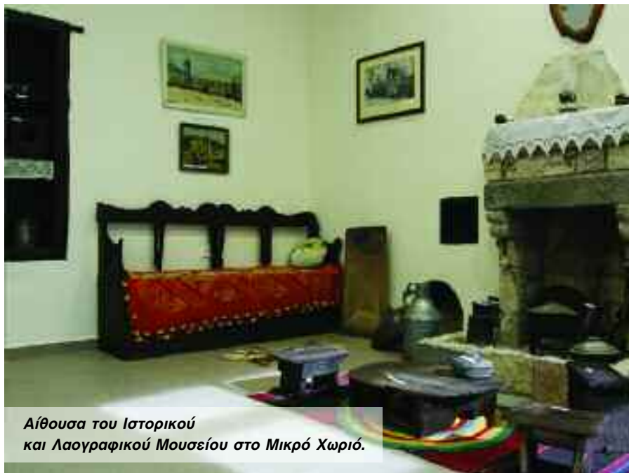
Αίθουσα του Ιστορικού και Λαογραφικού Μουσείου στο Μικρό Χωριό.