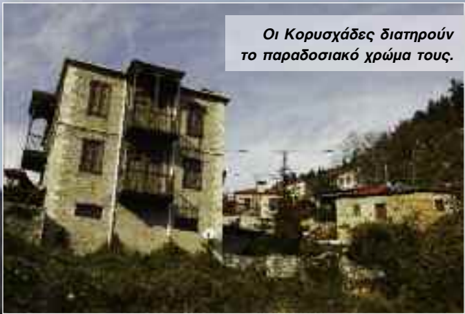
Οι Κορυσχάδες διατηρούν το παραδοσιακό χρώμα τους.