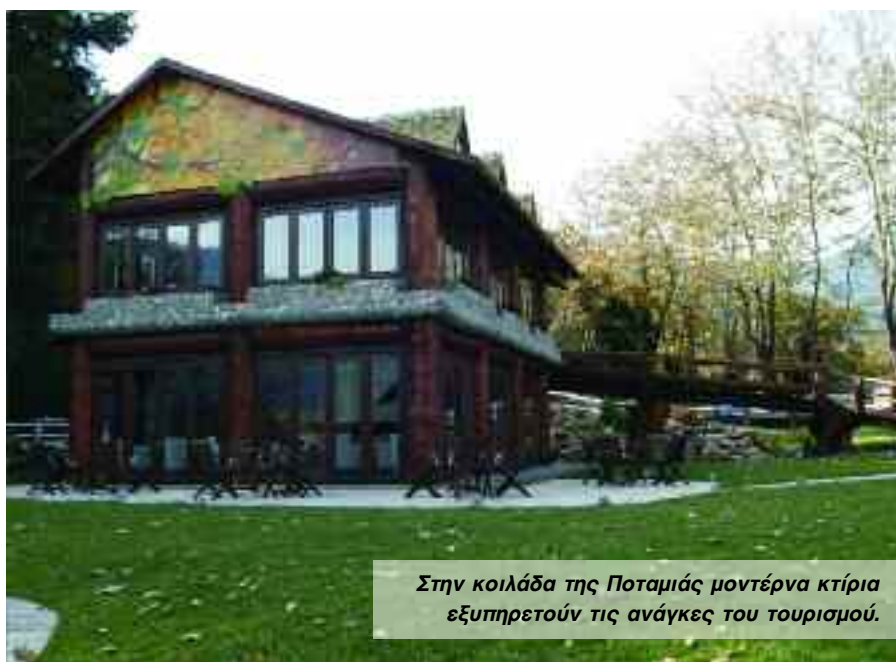
Στην κοιλάδα της Ποταμιάς μοντέρνα κτίρια εξυπηρετούν τις ανάγκες του τουρισμού.