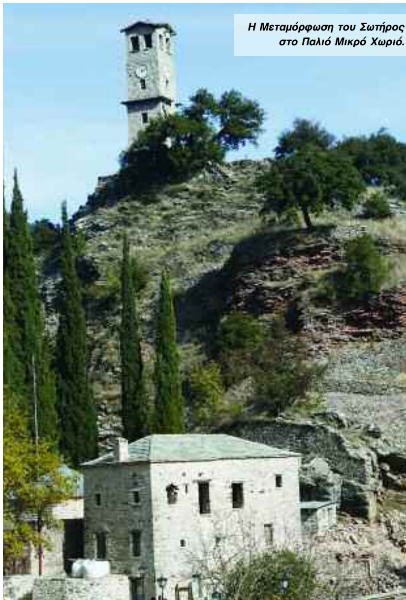
Η Μεταμόρφωση του Σωτήρος στο Παλιό Μικρό Χωριό.