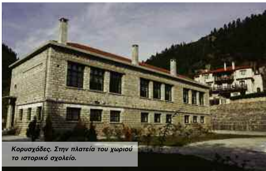
Κορυσχάδες. Στην πλατεία του χωριού το ιστορικό σχολείο.