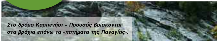
Στο δρόμο Καρπενήσι - Προυσός βρίσκονται στα βράχια επάνω τα «πατήματα της Παναγίας».