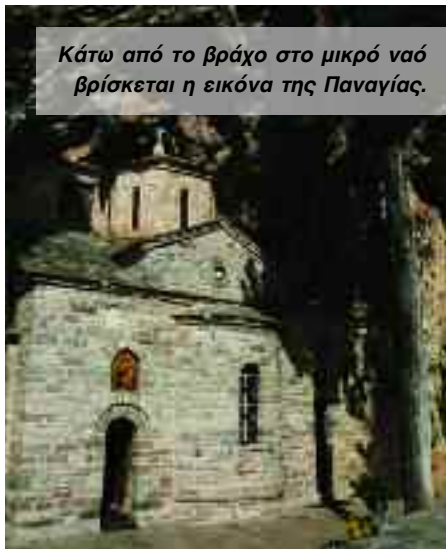
Κάτω από το βράχο στο μικρό ναό βρίσκεται η εικόνα της Παναγίας.

Αναδρομή στην ιστορική κληρονομιά του Μικρού Χωριού γίνεται στο αναδιοργανωμένο Ιστορικό και Λαογραφικό Μουσείο του Μικρού Χωριού. Στεγάζεται στο Δημοτικό Σχολείο του χωριού, που σταμάτησε τη λειτουργία του το 1963 μετά την κατολίωση. Ανάμεσα στα εκθέματα που παρουσιάζονται στις αίθουσές του, το μάτι σταμάτησε στην προθήκη με προϊόντα της καπνοβιομηχανίας «Έθνος Γ. Α. Κεράνης Α.Ε.». Η οικογένεια Κεράνη καταγόμενη από το χωριό αυτό βοήθησε στην ανοικοδόμηση το Νέου Χωριού, τη συντήρηση των μνημείων και την κοινωνική αρωγή με την προικοδότηση φτωχών κοριτσιών του χωριού. Σε αντίθεση με το Παλιό που κρατά το παραδοσιακό του χρώμα με τα σπίτια που υπήρχαν αλλά και αυτά που κτίζονται, το Νέο έχει περισσότερο τουριστικό χρώμα με τους πολυτελείς ξενώνες και τις ταβέρνες που λειτουργούν.