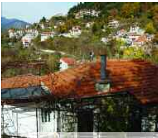
Μεγάλο Χωριό. Και εδώ αξιοποιήθηκαν οι φυσικές ομορφιές.

Ξεφυλλίζοντας το σύντομο τουριστικό οδηγό «Καρπενήσι '94» διαβάζω: Σύμφωνα με έρευνα επιτροπής της ΟΥΝΕΣΚΟ που έγινε το 1991 η Ευρυτανία θεωρείται μια από τις πρώτες πέντε περιοχές του κόσμου σε καθαρότητα περιβάλλοντος και αποτελεί τη βάση για τις μετρήσεις των ερευνητικών κέντρων, θεωρώντας ότι η μόλυνση είναι μηδενική. Ένας σημαντικός λόγος για να επισκεφτεί κανείς τα χωριά της Ευρυτανίας,