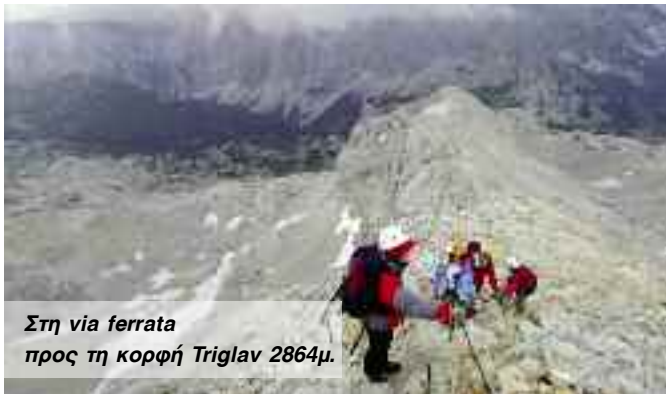
Στη via ferrata προς τη κορφή Triglav 2864μ.