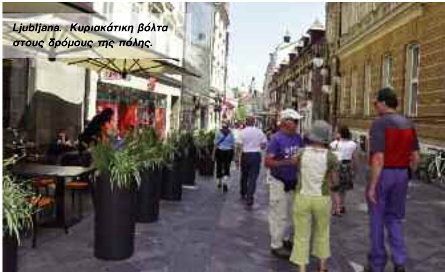
Λjubljana. Κυριακάτικη βόλτα στους δρόμους της πόλης.

Το όνομα Triglav (=τρικέφαλο) προέκυψε από το χαρακτηριστικό σχήμα του βουνού. Κατά κάποια άλλη εκδοχή, από μια Σλαβική θεότητα με τρία κεφάλια, το καθένα για να κυβερνά τη γη, τον ουρανό και τα έγκατα.