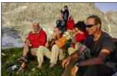
Στο καταφύγιο Zasavska Koca 2074μ.