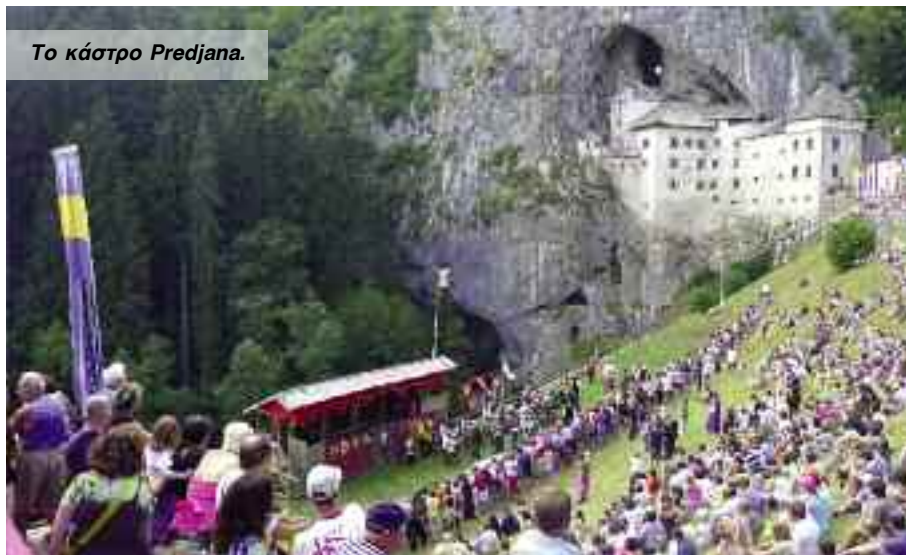
Το κάστρο Predjana.

Είναι Πέμπτη πρωί, 21 Ιουλίου, γύρω στις οκτώ και το μεγάλο F/B μπαίνει αργά αργά στον Πατριάκο κόλπο. Ετοιμαζόμαστε για την αποβίβαση και επιστροφή στο "κλεινόν άστυ". Οι Θεσσαλοί φίλοι έχουν ήδη κατεβεί στην Ηγουμενίτσα και οι Πατρινοί ετοιμάζονται. Χωρίζουμε συγκινημένοι, γεμάτοι αναμνήσεις και εικόνες που δύσκολα ξεχνιούνται και με την υπόσχεση να ξανασυναντηθούμε γρήγορα.