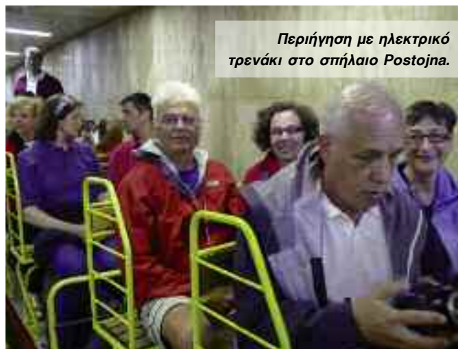
Περίηγηση με ηλεκτρικό τρενάκι στο σπήλαιο Postojna.