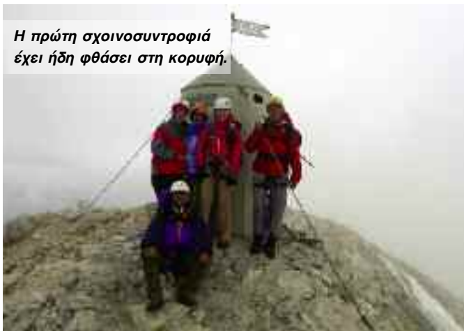
Η πρώτη σχοινοσυντροφιιά έχει ήδη φθάσει στη κορυφή.

Την Τετάρτη 13 Ιουλίου, αφού περάσουμε από το καταφύγιο Tzaska Koka στα 2151μ θα κάνουμε μια επίπονη ανάβαση στο Smarjčna Glava 2358μ για να φθάσουμε τελικά στους πρόποδες του Triglav στο καταφύγιο Dom Planica στα 2401μ.