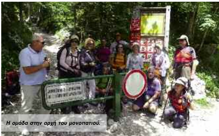
Η ομάδα στην αρχή του μονοπατιού.