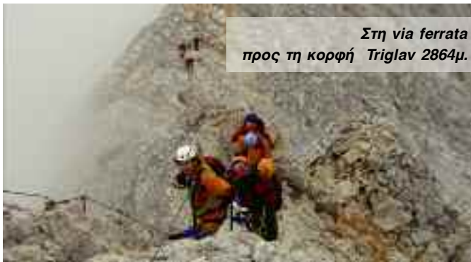
Στη via ferrata προς τη κορφή Triglav 2864μ.