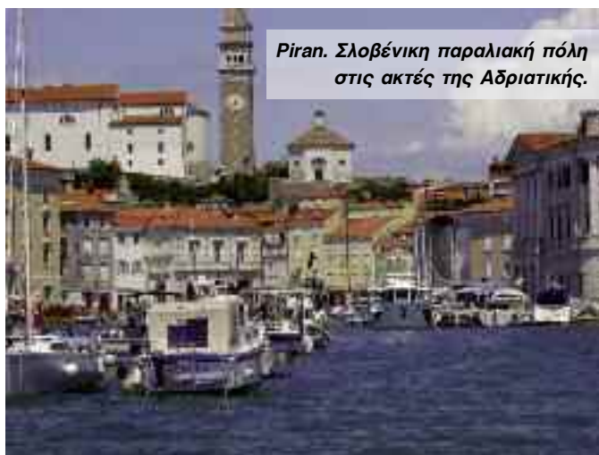
Piran. Σλοβένικη παραλιακή πόλη στις ακτές της Αδριατικής.