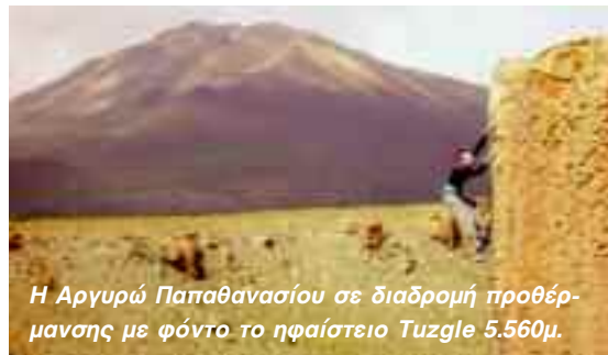
Η Αργυρώ Παπαθανασίου σε διαδρομή προθέρμανσης με φόντο το ηφαιστειο Tuzgle 5.560μ.

Όλοι έδωσαν Ραντεβού πάλι το φθινόπωρο και το χειμώνα.