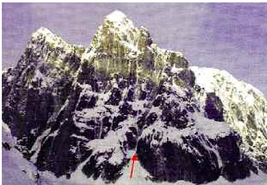
Οι ανατολικές ορθοπλαγιές των Bear (αριστερά) και Mooses Tooth από τον παγετώνα Buckskin.

Η Γαλλική Αλπική Ομοσπονδία, θέλοντας να βοηθήσει νέους ορειβάτες, επέλεξε 9 αναρριχητές μετά από επιλεκτικές αναρριχήσεις στο Ben Nevis, στο Matterhorn και τις Grandes Jorasses και με αρχηγούς, τους Frederic Gontet και Christophe Moulin, έκαναν το μακρύ ταξίδι ως την Alaska για να επαναλάβουν και να ανοίξουν διαδρομές. Ο στόχος αποκρυσταλλώθηκε... μετά από επιτόπια έρευνα και αφού στήθηκε το base camp στον παγετώνα Buckskin, όλα ήταν έτοιμα για προσπάθειες στο Mooses και Bear Tooth, που έδειχναν... διαθέσιμα για νέες γραμμές. Μετά από δυο εντυπωσιακές προσπάθειες ανοίχτηκαν δυο νέες διαδρομές, η Magic Mushrooms και η Bear Skin με όρθια κομμάτια πάγου (90ο), μικτά ως M6, τεχνητά A3 και πλαγιές ως 60ο που αποδείχθηκαν πολύ αγχώδεις και χρονοβόρες, αφού οι συνθήκες του χιονιού είναι πολύ διαφορετικές από αυτές που συναντάς στις ορθοπλαγιές των Άλπεων. Το φτυάρι ήταν ένα από τα πιο χρήσιμα εργαλεία... αναρρίχησης, κυρίως στα εντυπωσιακά μανιτάρια των κορυφών, που εντυπωσίασαν όλους τους νέους αλλά ταλαντούχους αλπινιστές...όλοι τους άρπαξαν όση εμπειρία μπορούσαν και ήδη καταστρώνουν τα μελλοντικά τους σχέδια στα Trango Towers, στην Patagonia ή στη Νότια ορθοπλαγιά της Acongaua. Οι Estelle, Max, Robin, Jeremy, Romain και Simon, σύντομα θα κάνουν γνωστά και τα μεγάλα τους ονόματα, στο χώρο του Αλπινισμού.