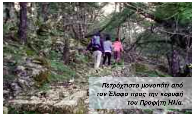
Πετρόχτιστο μονοπάτι από τον Έλαφο προς την κορυφή του Προφήτη Ηλία.