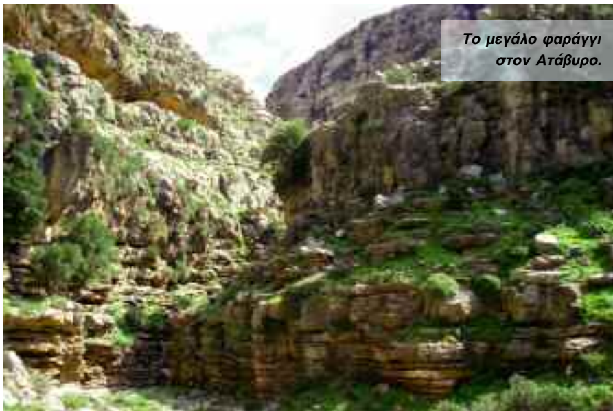
Το μεγάλο φαράγγι στον Ατάβυρο.

Στον Ακραμύτη και πάνω ακριβώς από τα Σιάνα έχουμε την πιο όμορφη ορθοπλαγιά της Ρόδου. Καταπληκτικός βράχος και εννέα δύσκολες διαδρομές σ' ένα σχετικά μικρό μέρος της ορθοπλαγιάς. Στο υπόλοιπο κομμάτι μπορούν να ανοιχτούν ακόμα πολλές διαδρομές με σπορ χαρακτήρα και με πολύ μεγαλύτερο ανάπτυγμα. Κατηφορίζουμε από τα βουνά και αφήνουμε πίσω τη βόρεια ορθοπλαγιά του Προφήτη Ηλία με μι-