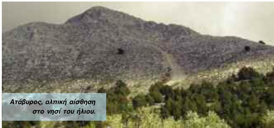
Ατάβυρος, αλπική αίσθηση στο νησί του ήλιου.