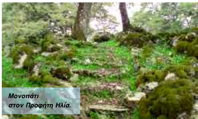
Μονοπάτι στον Προφήτη Ηλία.