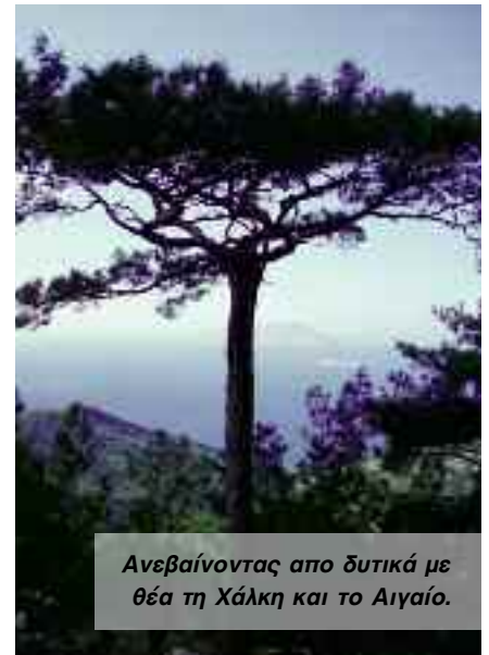
Ανεβαίνοντας από δυτικά με θέα τη Χάλκη και το Αιγαίο.