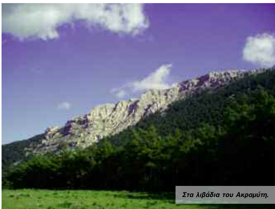
Στα λιβάδια του Ακραμύτη.