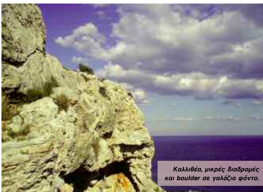
Καλλιθέα, μικρές διαδρομές και boulder σε γαλάζιο φόντο.