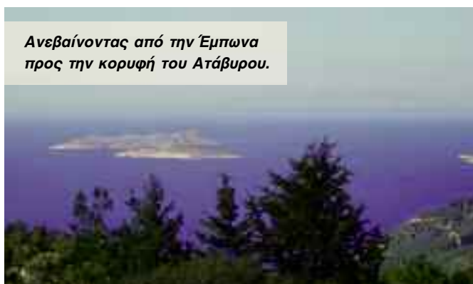
Ανεβαίνοντας από την Έμπωνα προς την κορυφή του Ατάβυρου.