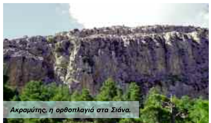
Ακραμύτης, η ορθοπλαγιά στα Σιάνα.