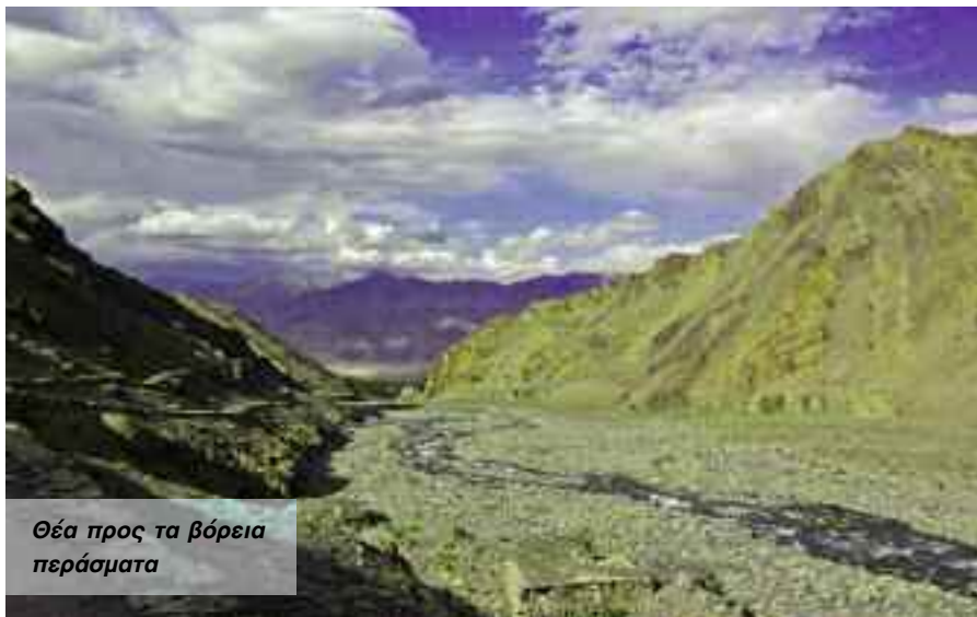
Θέα προς τα βόρεια περάσματα