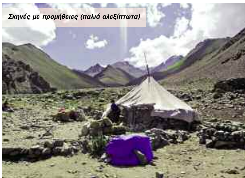
Σκηνές με προμήθειες (παλιά αλεξίπτωτα)