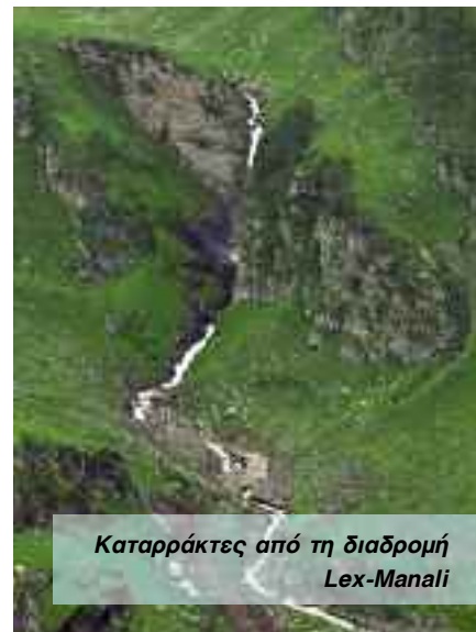
Καταρράκτες από τη διαδρομή Lex-Manali

που απέχει σχεδόν μισή ώρα περπάτημα από το πρωτόγονο αεροδρόμιό τους. Βέβαια τα ταξί πάντα στη διάθεση του κόσμου και σίγουρα θα βρείτε δυτικούς και κυρίως Εβραίους που ψάχνουν απεγνωσμένα για shared ride δηλαδή να μοιραστούν την κούρσα. Γεύσεις, κόσμος και φαγητό είναι οι πρώτες εντυπώσεις αλλά κανείς δεν πρέπει να μείνει εκεί. Στο Λεχ υπάρχει πληθώρα δυνατοτήτων για όσους είναι ανήσυχα πνεύματα. Αρκετά Meditation centers με μαθήματα γιόγκα, μασάζ, αυτοσυγκέντρωσης και αυτογνωσίας για όσους θέλουν να βρουν τη γαλήνη συνδυάζοντάς τα με επισκέψεις στα τοπικά μοναστήρια όπως αυτό του Shey ή και άλλων τα οποία τα επισκέπτεται και ο Δαλάι Λάμα τουλάχιστον μια φορά το χρόνο. Τα μοναστήρια αυτά λειτουργούν ως τόποι λατρείας, κατάνυξης, συγκέντρωσης, μουσεία μα και σχολεία για τους νεαρούς μοναχούς που είναι σε νηπιακή ακόμα ηλικία. Υπάρχουν όμως και αρκετά γραφεία τα οποία οργανώνουν απλές πεζοπορίες μέχρι αποστολές σε κορυφές άνω των 7000μ. με πιο διάσημη κορυφή το Stok Kangri. Οργανωμένα μονοπάτια στα χαμηλά και πανέτομοι οδηγοί βουνού