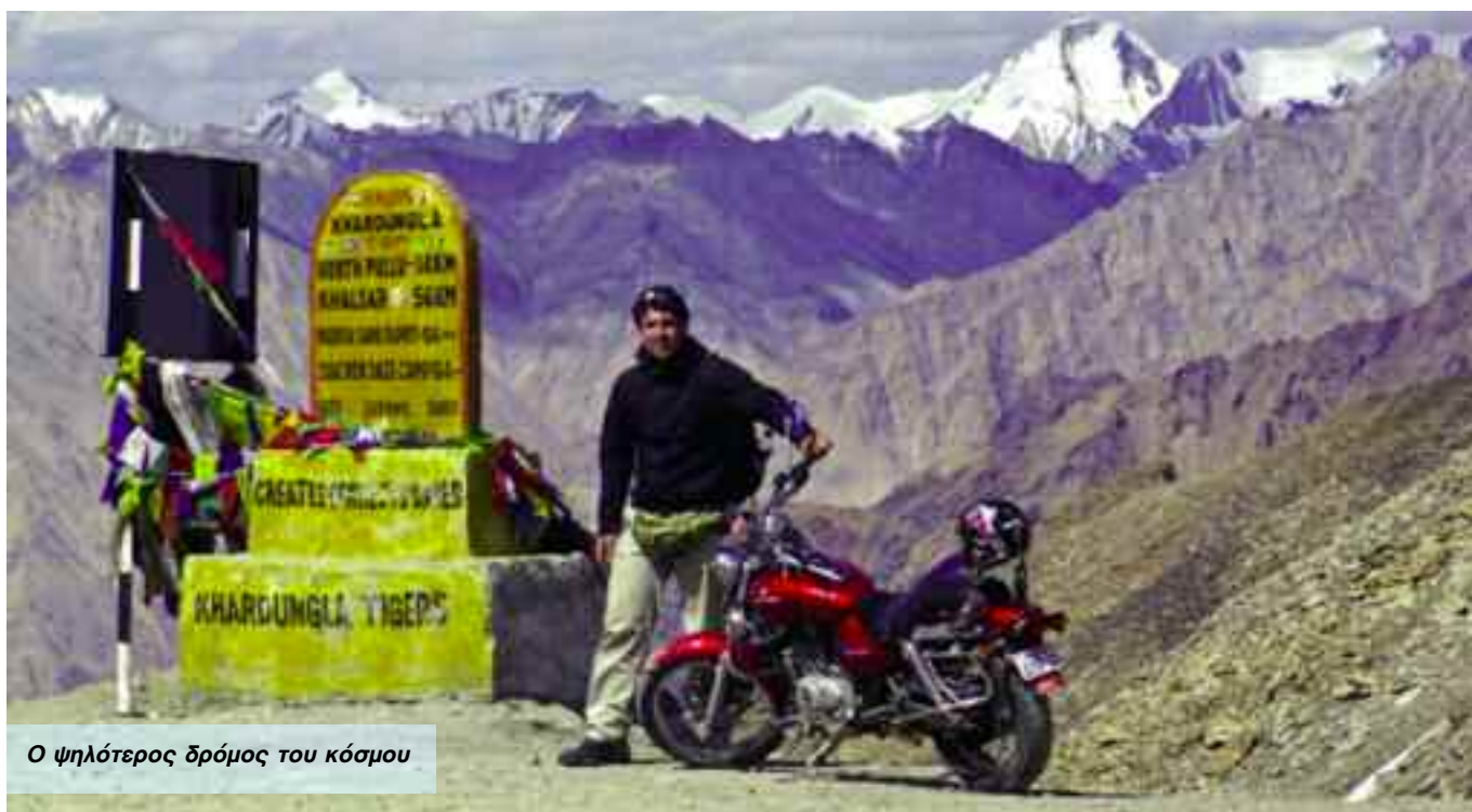
Ο ψηλότερος δρόμος του κόσμου