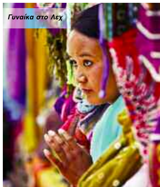
Γυναίκα στο Λεχ