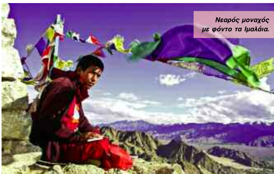
Νεαρός μοναχός με φόντο τα Ιμαλάια.